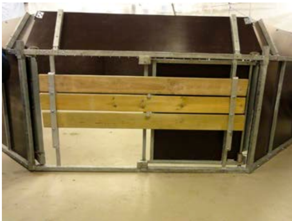
Figur 3. Ingångsöppning