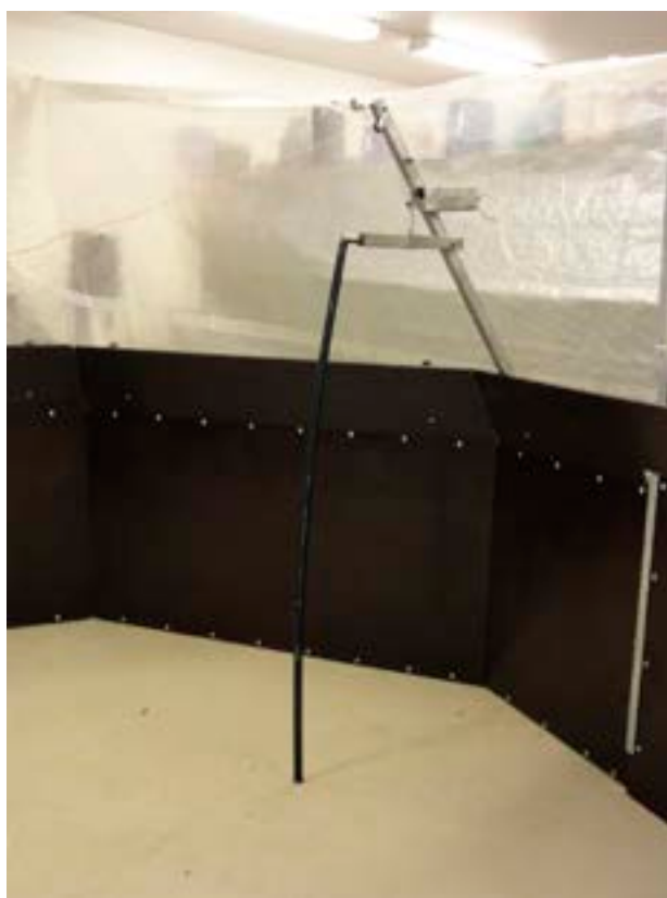
Figur 2. Gilleranordning