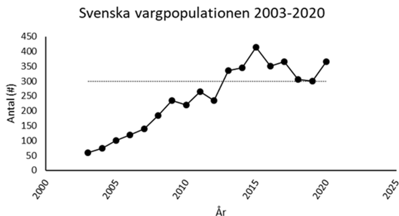
Figur 2. Utveckling av den svenska vargstammen 2003-2020 23 .

Uppställt mot vargstammens utveckling över tid kan man se att avhållsamheten i att inte bevilja någon licensjakt då vargstammen antalsmässigt närmar sig referensvärdet för gynnsam bevarandestatus har varit välavvägt. Stammen återhämtar sig och ökar i antal. Detta bekräftar också att de beslut om skydds jakt som utfärdas inte hotar gynnsam bevarandestatus för vargen ur ett antalsperspektiv. Länsstyrelsen bör ta denna information i beaktande vid en bedömning av ett långsiktigt hållbart uttag för licensjakt på varg.