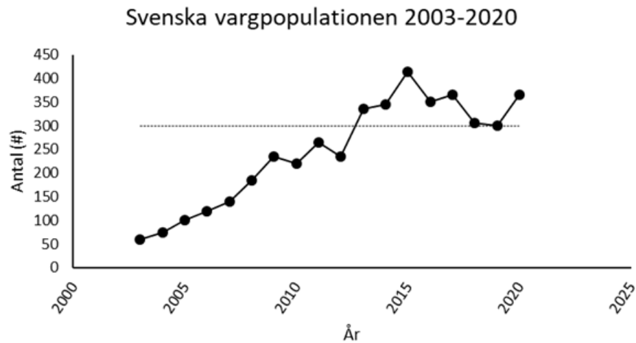
Figur 1. Utveckling av den svenska vargstammen 2003-2020 12 .

SKANDULV bedömer att den illegala jakten kan ligga på 15-20% av den totala mortaliteten för populationen nationellt.