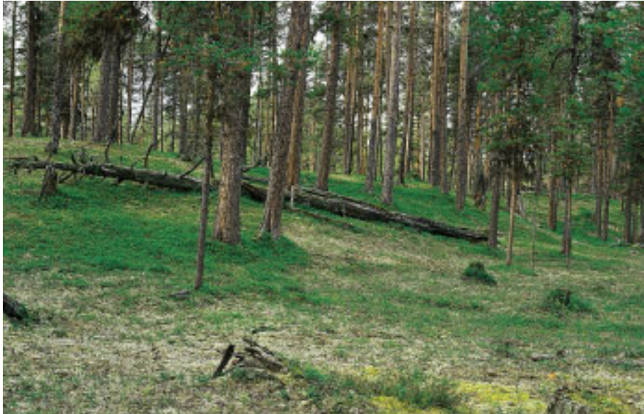
Sandtallskogar är den huvudsakliga växtmiljön för blåfotad och skrovlig taggsvamp ( S. glaucopus och S. scabrosus ). I denna miljö finns även några andra rödlistade mykorrhizasvampar.