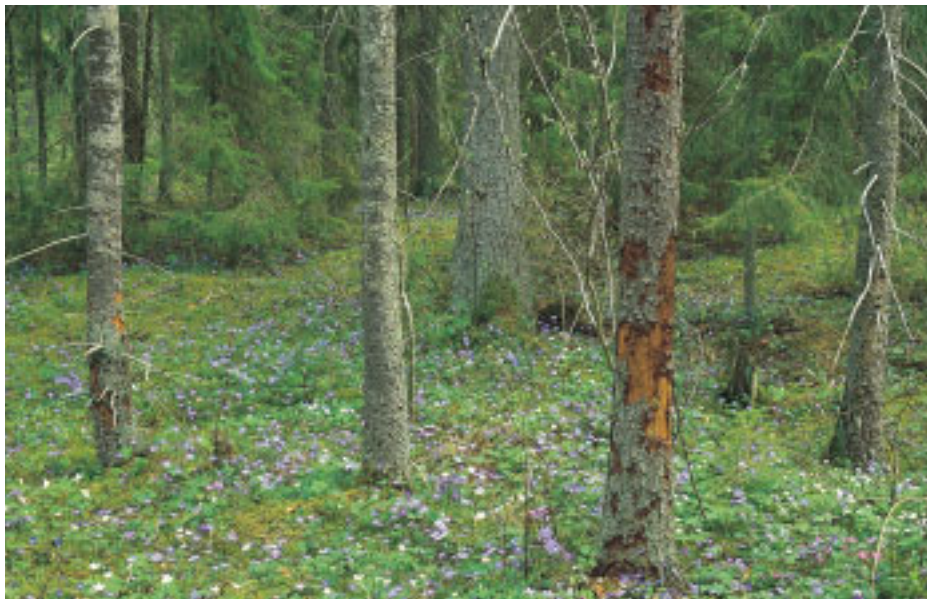
Blåsippgranskog – en viktig miljö för många arter av fjälltaggsvampar och andra rödlistade mykorrhizasvampar.