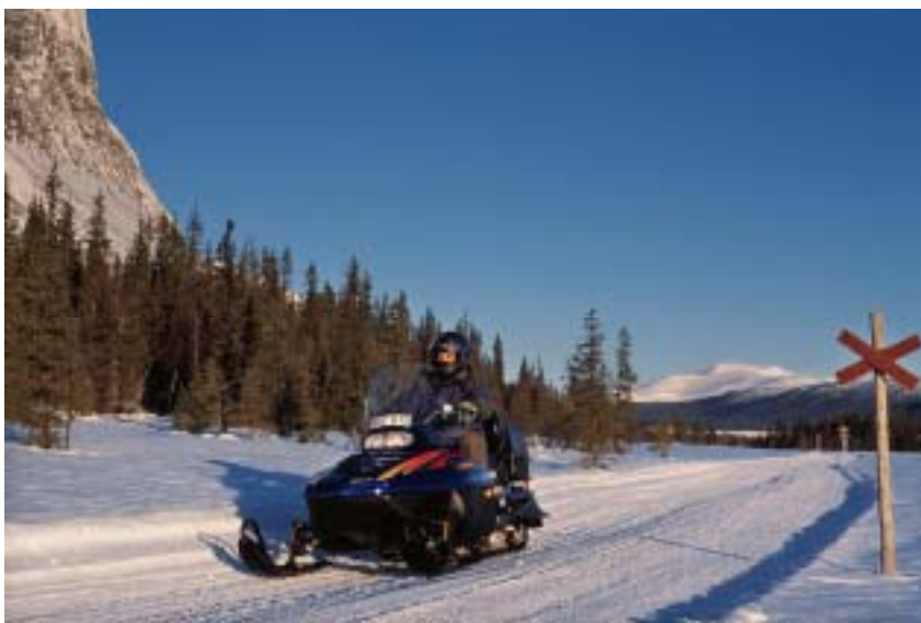
Ett gott exempel på skoterkörning längs påbjuden markerad led.

I följande avsnitt ges exempel på olika typer av inskränkningar i möjligheten att köra i snötäckt terräng.