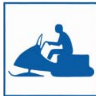
Lämplighetsmärke Här kör du säkrast och stör minst