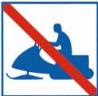
Olämplighetsmärke Skoterkörning olämplig