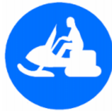
Påbudsmärke Förbjudet att köra utanför leden