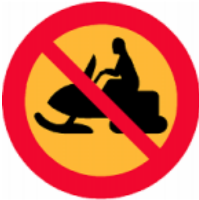
Förbudsmärke Skoterkörning förbjuden

Det är viktigt att känna till att skoteråkare alltid och i alla sammanhang har väjningsplikt mot alla som färdas i terrängen, även på skoterleder.