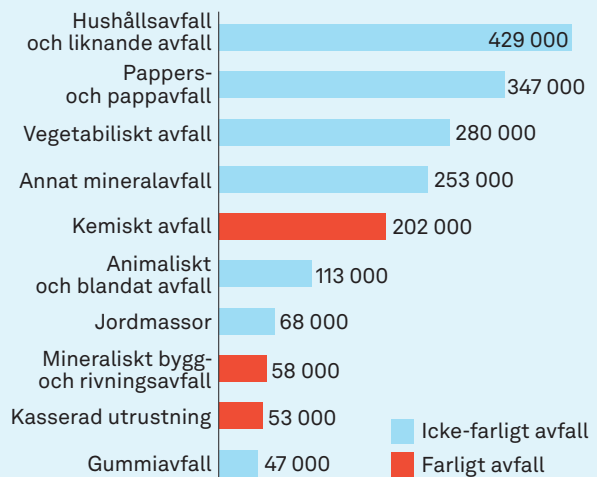
Tjänstebranschernas största avfallsslag 2020 ton

Flera av de vanligaste typerna av avfall är även sådana som ofta uppkommer i hushåll. Hushållsavfall och liknande avfall är en självklar sådan fraktion, men även förpackningar, matavfall och elektronikavfall. Därför kan det vara svårt att avgöra om ett visst avfall har uppstått i tjänstebranschen eller i hushållssektorn. Detta bidrar till osäkerheter i statistiken.