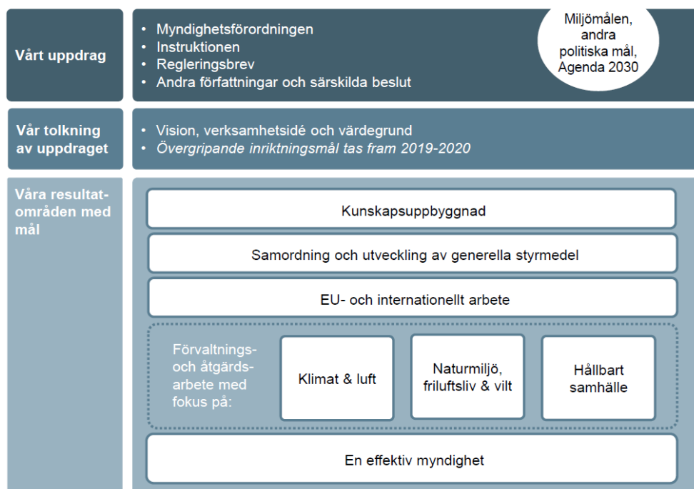
Figur 1. En illustration av Naturvårdsverkets styrmodell där planeringsstrukturen ingår.

I kapitel 6 beskrivs hur våra ansvarsområden påverkas och vilka aktiviteter och åtgärder som vi avser att arbeta vidare med för att anpassa verksamheten till ett förändrat klimat. Detta kapitel har delats in i sju resultatområden enligt styrmodellen: Kunskapsuppbyggnad, Samordning och utveckling av generella styrmedel i miljöarbetet, EU- och internationellt arbete, Klimat och luft, Naturmiljö, friluftsliv och vilt, Hållbart samhälle samt en Effektiv myndighet (Figur 1). Under respektive avsnitt redogörs kortfattat för hur området påverkas av ett förändrat klimat, hur Naturvårdsverket arbetar med klimatanpassning i nuläget samt vilka klimatanpassningsåtgärder som vi avser prioritera under kommande år. Genom att dela in handlingsplanens åtgärder enligt vår styrmodell underlättas organisering, prioritering och uppföljning av handlingsplanens aktiviteter och åtgärder.