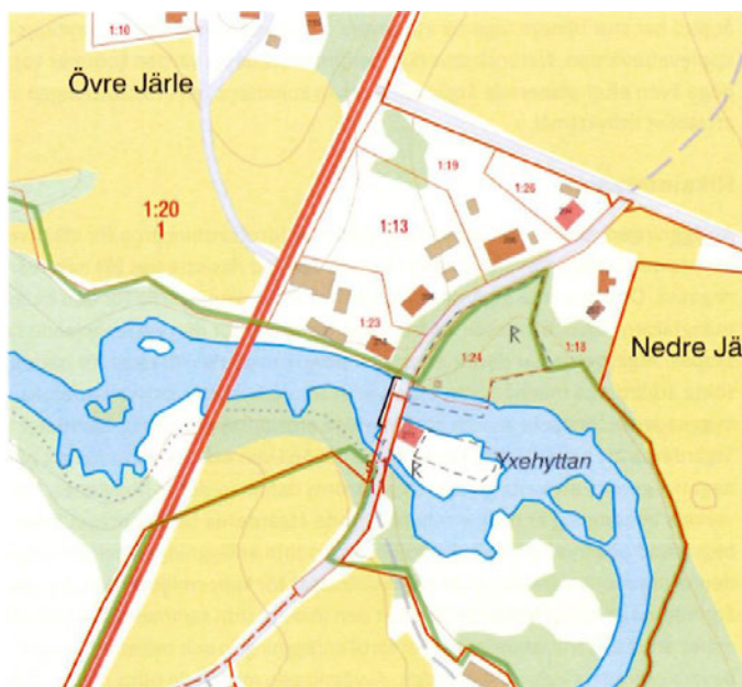
Figur. Fastighetskarta över området

Samtliga åtgärder i vatten och tillfartsvägar utförs inom Naturvårdsverkets egna fastigheter, Nora Järle 1:25 och 1:24 (tillträde enligt köpekontrakt den 6 april 2018), och dammanläggningen ägs av Naturvårdsverket. Naturvårdsverket har därför den rådighet som krävs för att genomföra de planerade åtgärderna. Naturvårdsverket har även rådighet enligt 2 kap 5 § lagen (1998:812) med särskilda bestämmelser om vattenverksamhet då det är fråga om åtgärder som är önskvärda från allmän miljösynpunkt.