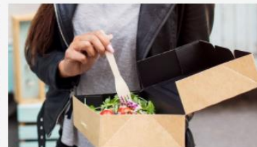
Nytt liv för fjällens natur