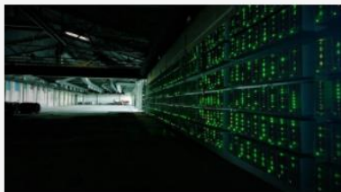
Transport till och från server och datacenter