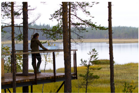
6.31 Bildnamn: 6.31_Svansjön_Hamra_ TomasArlemo_Lst_MG_3045 Motiv: Svansjön, Hamra OBS! Gratis t.o.m. 2021