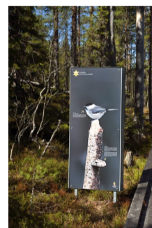
6.45 Fotograf: Ist Gävleborg Bildnamn: 6.45_Skylt_ Lansstyrelsen_Gävleborg_ DSC6734 Motiv: Skylt