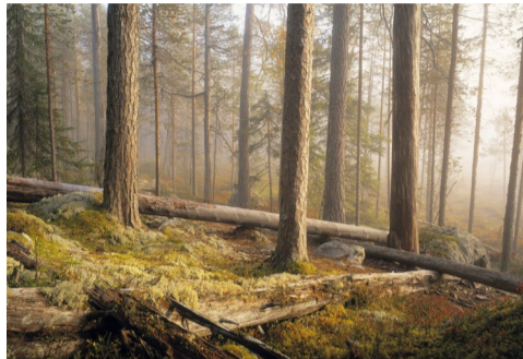
6.11 Bildnamn: 6.11_hamra_Skog_Tore- Hagman_IBL_027nf672 Motiv: Naturskog, Hamra NP