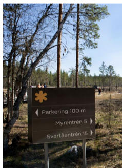
6.42 Bildnamn: 6.42_ Skylt_Lansstyrel- sen_Gävleborg_ DSC6693 Motiv: Skylt