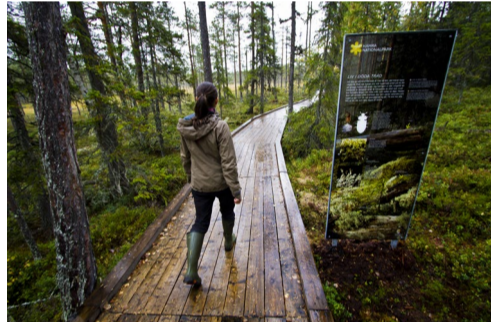
6.32 Bildnamn: 6.32_Besokare_Tomas Arlemo_ Lst_MG_3080 Motiv: Besökare OBS! Gratis t.o.m. 2021