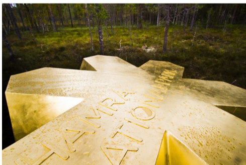
6.43 Bildnamn: 6.43_Nationalparksmar- ke_TomasArlemo_Lst_MG_3262 Motiv: Nationalparksmarke OBS! Gratis t.o.m. 2021