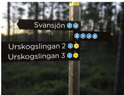
6.41 Bildnamn: 6.41_Skyltar_ Lansstyrelsen_Gävleborg_ DSC7384 Motiv: Skyltar