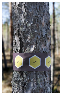
6.44 Bildnamn: 6.44_Tardmarke- ring_Lansstyrel- sen_Gävleborg_ DSC6701 Motiv: Trädmar- kering