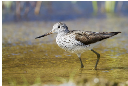
6.21 Bildnamn: 6.21_JorgenWiklund_Johner_scandinav_iuwz Motiv: Gluttsnäppa