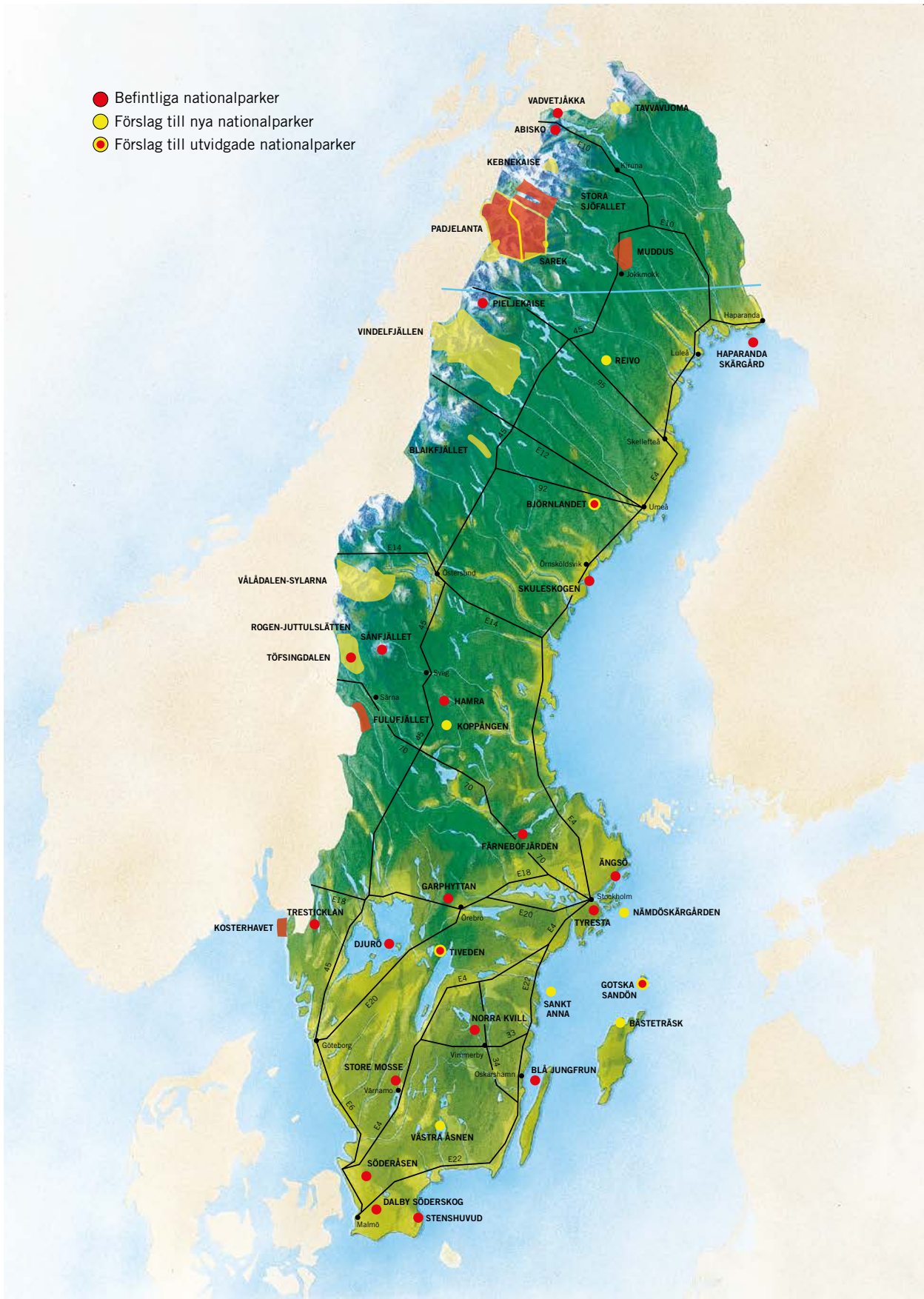
Kartan (Naturvårdsverket och Hans Sjögren).