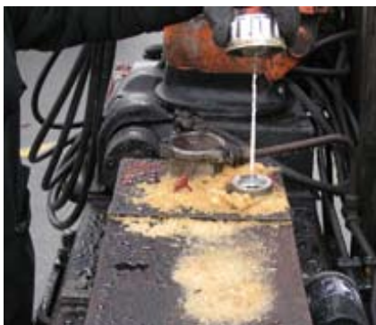
Bilmotor som innehåller olja.

Exportera inte reservdelar som är i så dåligt skick att de inte utan vidare kan återanvändas eller mycket snart blir avfall/farligt avfall. Bilmotorer får inte innehålla olja och även oljefilter måste avlägsnas.