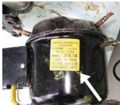
Kylskåpskompressor märkt med R12