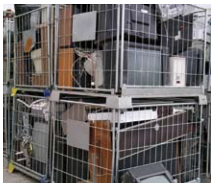
Produkter som samlats in via insamlingsystem.