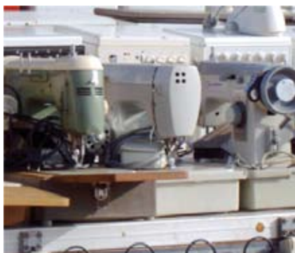
Föråldrade elektriska symaskiner.