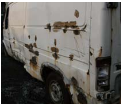
Omfattande rostskada/undermålig kaross.