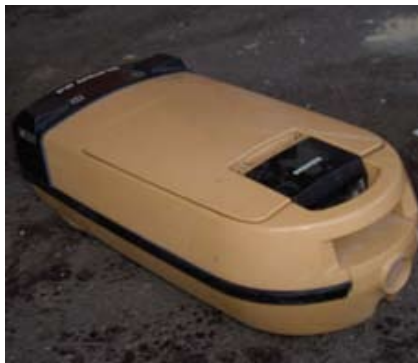
Dammsugare utan slang