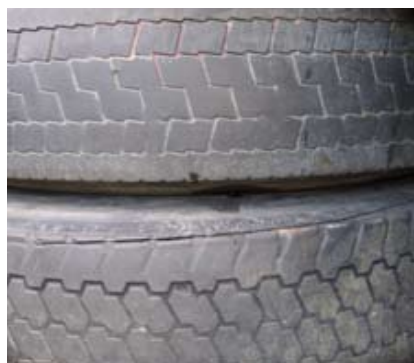
Exportera inte utslitna däck.