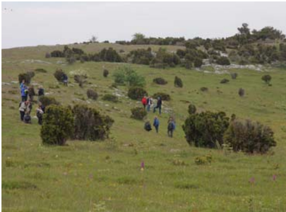
Botanikexkursion. Under Naturens år 2009 pågick många evenemang som engagerade allmänheten i frågor om naturvård och biologisk mångfald.

CBD har ett särskilt arbetsprogram för att sprida kunskap och medvetande om biologisk mångfald, eftersom alla problem som biologisk mångfald möter ytterst bottnar i människors svårigheter att se kopplingen mellan biologisk mångfald och mänsklighetens livsvillkor. I Sverige finns ingen nationell strategi för att leva upp till ambitionen. Svenska myndigheter och kommuner gör olika satsningar för att öka medvetenheten om biologisk mångfald som naturstigar, grönområden i städer, attitydundersökningar och skolprojekt. Inom det gemensamma projektet Naturens år 2009 , för att fira 100 årsjubileum av svensk naturvård och de första nationalparkerna, har ett flertal myndigheter och intresseorganisationer bildat en plattform för att skapa engagemang och sprida kunskap om naturvård och biologisk mångfald.