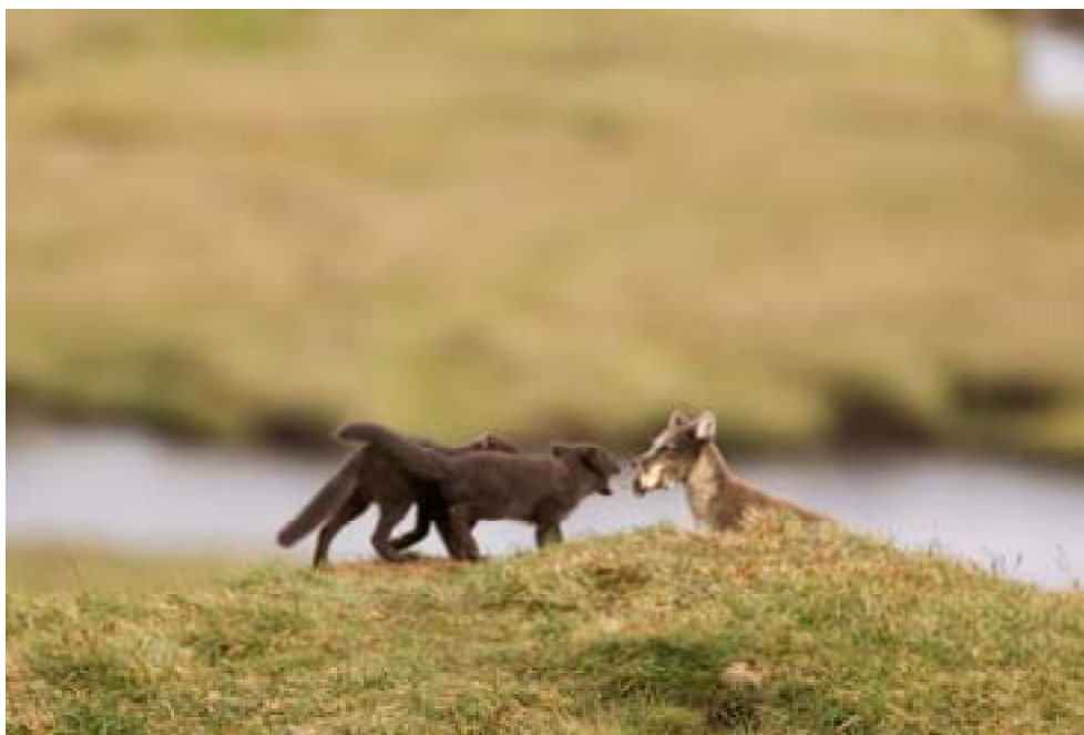
Fjällräven ( Alopex lagopus ) är akut hotad och förekommer i små fragmenterade populationer i hela det svenska kalfjällsområdet. Ett av hoten mot den är födobrist orsakat av rödrävens expansion norrut. I dagsläget finns åtgärdsprogram framtagna för sex hotade arter knutna till fjällområdet varav ett berör fjällräven.

Fjällområdet förser oss med vatten, energi, mineraler och möjligheter till rekreation. Här har människor levt med naturen under lång tid. I området är renskötseln en levande näring med över 250 000 renar. Renbetet motverkar igenväxning av fjället med björk- och videsnår och främjar på så sätt förekomsten av mindre konkurrenskraftiga växter. Även övrigt mångbruk av fjällets betesresurser i form av fåbodbruk har spelat en viktig roll under lång tid för den biologiska mångfalden. Numera är den bruksformen nästan borta ur fjällområdet.