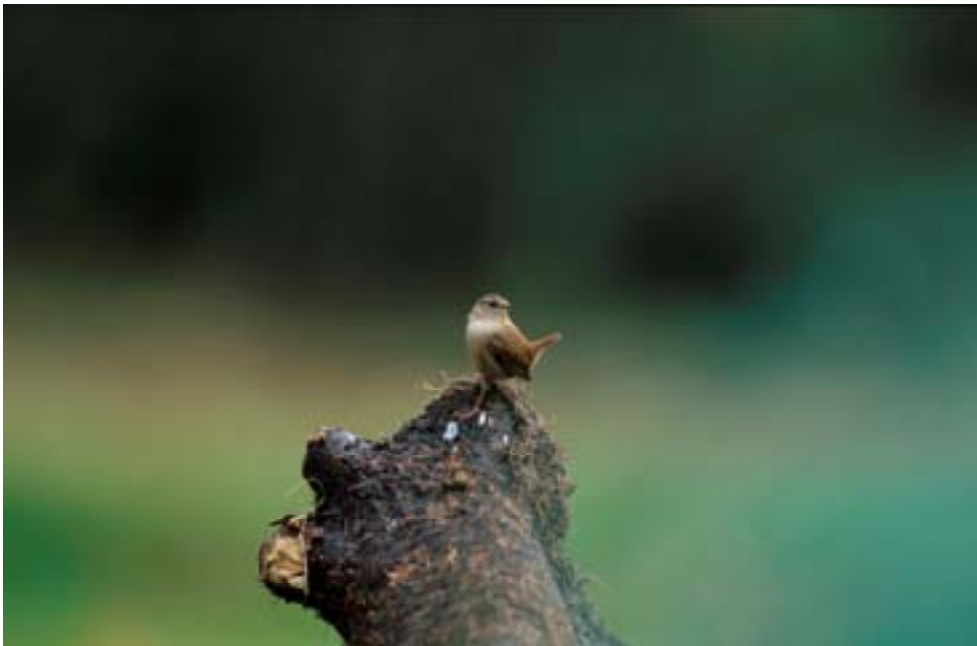
Gärdsmygen ( Troglodytes troglodytes ) har ökat kraftigt i antal sedan 1990-talet på grund av att den gynnas av ett varmare klimat.

På 1950-talet började skog avverkas i stor skala i Sverige. Den skogsmark som återplanteras har betydligt kortare omloppstid än naturskog och är tätare med ett tjockt humuslager. Det gör att den innehåller få habitat för specialiserade skogslevande arter. Under de senaste 50 åren har arealen skogsbestånd äldre än 160 år halverats. Sedan 1800-talets början har omkring 100 skogslevande arter utrotats från Sverige. I en typisk kommersiell barrskog finns 16 så kallade ekologiska nischer 23 , medan en naturskog innehåller över 100 nischer 24 .