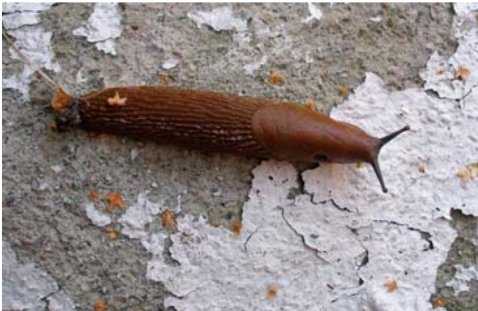
Spansk skogsnigel ( Arion lusitanicus ) – också känd som "mördarsnigeln" – är en invasiv art som från mitten av 1980-talet spridit sig snabbt i Sverige. Den orsakar stora skador på i trädgårdar och kan bli ett stort problem även för jordbruksväxter. Den spanska skogsnigeln har få naturliga fiender. Spridningen har underlättats av att ingen myndighet har tagit ansvar för problemiken.

vakning och utrotning. Hotet från främmande arter kan dels vara av ekologisk art där de konkurrerar ut inhemska arter, dels av genetisk art där främmande genotyper (dvs genetiskt främmande individer av samma art som förekommer inhemskt) kan bidra till att förändra inhemska arters genupsättning. Vidare finns risk att invasiva främmande arter kan sprida sjukdomar som påverkar såväl människa som flora och fauna. Slutligen kan invasiva främmande arter vara skadeorganismer som hotar skogsbruk eller jordbruk, eller har negativ ekonomisk påverkan på andra sätt. Att bekämpa redan introducerade arter innebär ofta höga kostnader. Med ökad global handel, fler och snabbare transporter samt klimatförändringar ökar även risken för introduktion av fler främmande arter.