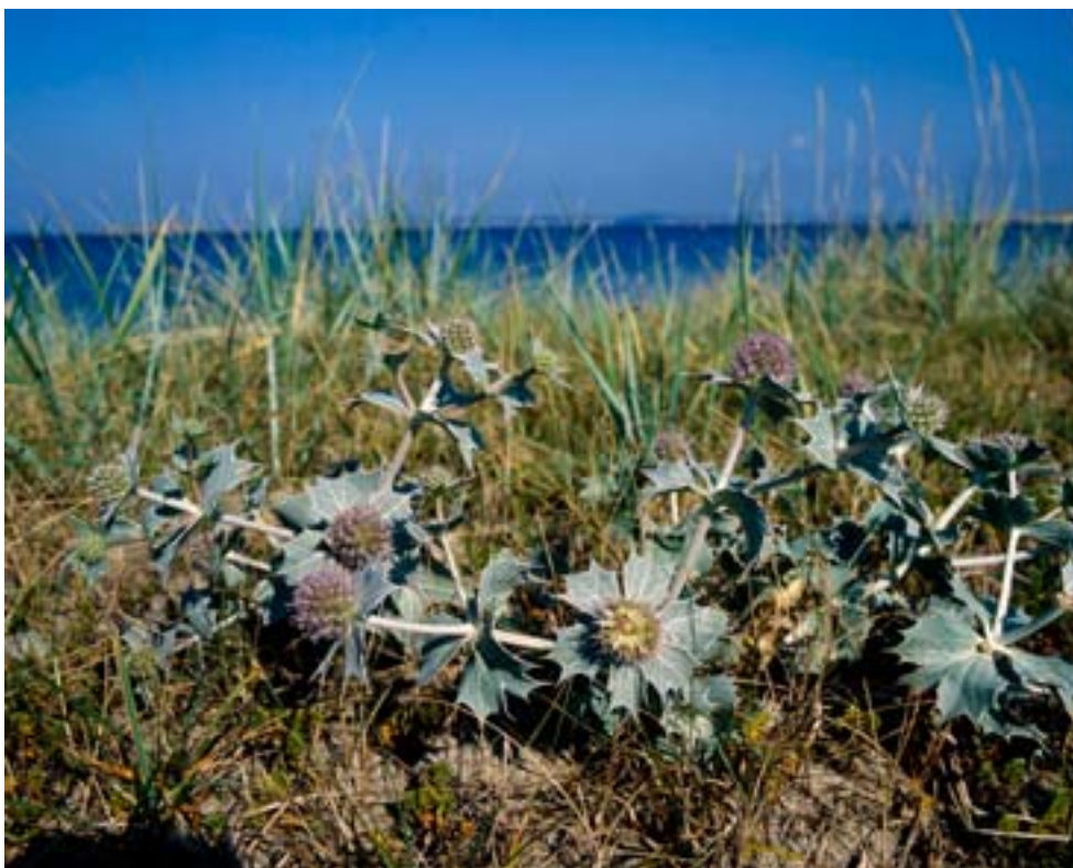
Martorn ( Eryngium maritimum ) växer uteslutande längs kusterna från Bohusläns norra kust till Gotlands och Ölands kuster. Den trivs i sandiga miljöer med begränsad konkurrens om näring, ljus och utrymme. Blommorna är välbesökta av olika insektsordningar – steklar, fjärilar och skalbaggar. Sedan 2008 finns ett åtgärdsprogram för att öka kunskapsnivån och säkerställa stabila populationer.

Regeringen gav 2005 Fiskeriverket i samråd med Naturvårdsverket uppdraget att inrätta sex fiskefria områden till 2010. Syftet var att minska risken för beståndskollaps samt att bygga upp fiskbestånd med naturlig genetisk variation och ålderssammansättning. Som en följd av den allvarliga situationen för torsken i Kattegatt beslöt Sverige och Danmark tillsammans 2008 att införa totalt fiskeförbud i ett av torskens viktigaste lekområden.