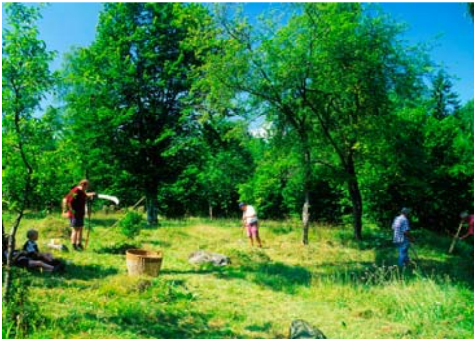
Ängsslätter med traditionella brukningsmetoder gynnar biologisk mångfald. Här finns en stor rikedom av blommande växter och mångfald av insekter. Slättermarker och lövängar har minskat kraftigt under 1900-talet.

Mångfaldskonventionen trycker på lokala befolkningars rätt till biologisk mångfald. För att främja genomförandet av artikel 8 (j) beslöt partsmötet 2000 13 att inrätta ett arbetsprogram som arbetar för att ursprungsbefolkning och lokala samhällen ska ges full rätt att delta i de beslutsfattande processer som handlar om traditionell kunskap och biologisk mångfald.