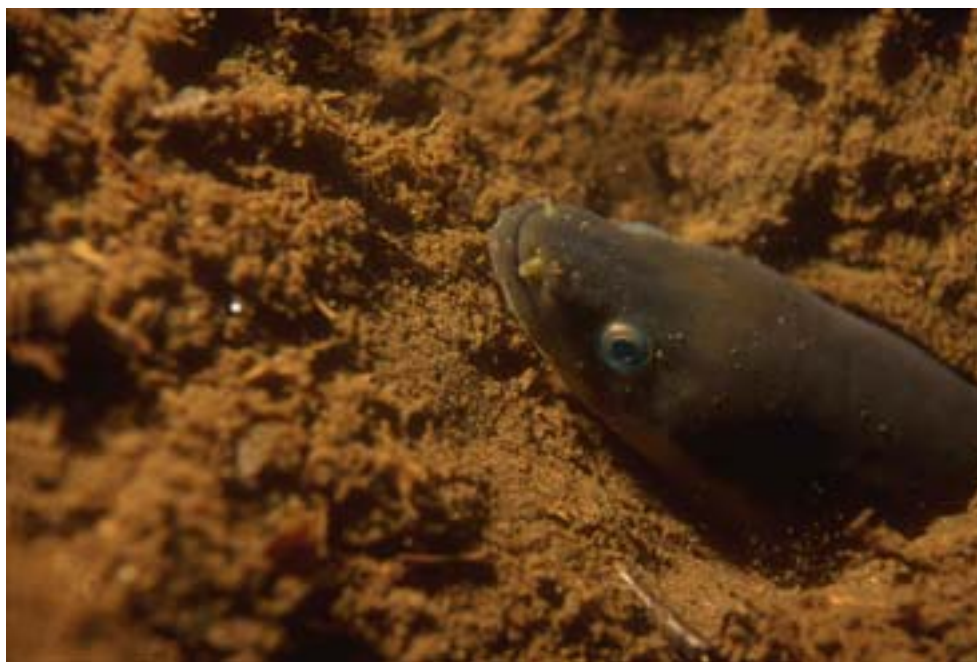
Ålen ( Anguilla anguilla ) leker och dör i det salta och varma Sargassohavet, de nykläckta larverna driver sedan till Europas kuster med Golfströmmen och den Nordatlantiska strömmen där de anländer i det stadie som kallas glasål. Ålen är idag akut hotad, sedan mitten av 1980-talet har rekryteringen av glasål till Europa minskat med över 90 %.

En alltför stor och effektiv fiskeflotta överutnyttjar en i princip förnybar resurs och problemen med bifångster är inte lösta. För att komma till rätta med situationen krävs både internationellt samarbete och ytterligare nationella åtgärder. Under miljökvalitetsmålet för havet finns delmålet Uttag och återväxt av fisk som handlar om att återställa marina populationer till livskraftiga miljöer. Stora förändringar i fiskfaunan har under de senaste 20 åren skett på grund av det hårda fisketrycket. Torsken i Östersjön har till exempel minskat kraftigt, vilket möjliggjort en kraftig expansion av skarpsill. Läget är allvarligt för flera kommersiellt nyttjade fiskarter, bland annat ål och torsk.