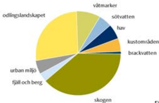
Figur 2. Fördelningen av Sveriges rödlistade arter mellan olika landskapstyper.

Konventionen har utarbetat sju tematiska arbetsprogram (för biologisk mångfald i odlingslandskapet, skogen, torra områden, sötvatten inklusive våtmarker, öar, kust- och havszoner samt bergsområden) som alla uttrycker visioner för bevarande och hållbart nyttjande inom några av jordens huvudsakliga ekosystemtyper. Arbetsprogrammen anger principer för hur CBD ska genomföras på nationell nivå, med många konkreta mål och åtgärder. Fem av de sju ekosystemtyperna återfinns i de svenska nationella miljö kvalitetsmålen.