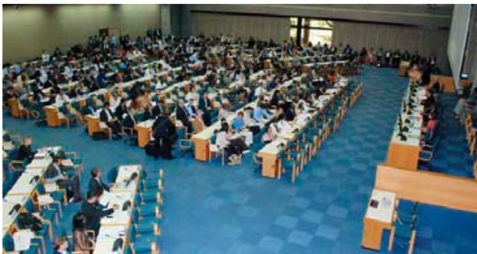
Ett förberedande möte inför konventionens tionde partsmötet hölls i maj 2010 i Nairobi, Kenya.

Den här skriften är en uppdaterad sammanfattning av den fjärde nationella rapporten till CBD:s sekretariat som Sverige tog fram i mars 2009. En tanke med den nationella rapporteringen är att stimulera länderna till att finna vägar för att förbättra och effektivisera sitt eget arbete. En del av den här rapporten återspeglar de miljökvalitetsmål som kopplar till biologisk mångfald. Utöver detta finns ett avsnitt med arbetsområden som ingår i konventionsarbetet, men som inte har någon direkt motsvarighet i miljökvalitetsmålen. Det går att ladda ned samtliga rapporter från CBD:s sekretariat på internetadressen http://www.cbd.int/reports .