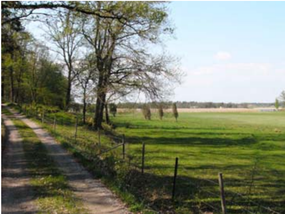
Den biologiska mångfalden i jordbrukslandskapet hotas idag av förändrad markanvändning och förändrade brukningsmetoder, till exempel intensivare odling med större monokulturer. Arrika naturbetesmarker har under 1900-talet minskat kraftigt.

Den andra delen (av fyra) i CBD:s arbetsprogram för odlingslandskapet handlar om att förvalta den biologiska mångfalden i odlingslandskapet. Det största hotet mot biologisk mångfald är förändrad markanvändning, men även intensifierade brukningsmetoder. Intensivare odling med större monokulturer, och övergivna traditioner såsom slåtter och bete gör hela landskapet alltmer likriktat. Dessutom försvinner småbiotoper som stenväddar, gårdsgårdar och små våtmarker från intensivt odlade ytor. Det finns en fara att likriktningen drivs fram ytterligare genom ökad efterfrågan på biobränsle.