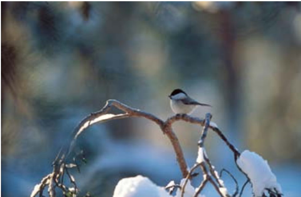
Talltitan ( Parus montanus ) är en av de arter som minskat drastiskt de senaste 30 åren på grund av dagens skogsbruk.

CBD:s programområde 1 handlar om att skydda och restaurera skogens mångfald. Det finns 23 åtgärdsprogram som berör 52 hotade arter i skogen. Idag täcks 58 % av Sveriges landyta av skog. Nära 24 miljoner hektar mark är produktiv skogsmark, varav 900 000 ha är skyddad. Trots en dramatisk nedgång under 1900-talet