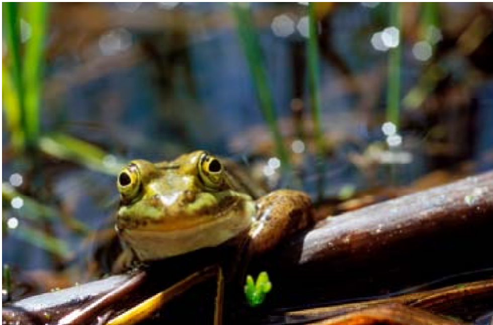
Gölgrodan ( Rana lessonae ) lever i grunda och kustnära gölar och är fridlyst i Sverige sedan 1985. Den hotas främst av storskaligt skogsbruk som försvårar spridning och dikning som leder till torrläggning.

Enligt CBD:s artikel 8 ( in-situ conservation) skall parterna restaurera ekosystem och vidta åtgärder för att hjälpa hotade arter att återhämta sig. Detta finns också