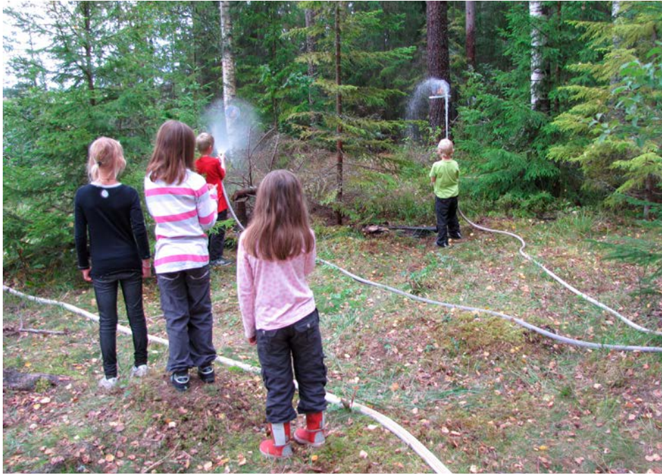
Bild 17. Länsstyrelsen i Dalarna arbetar aktivt med naturvägledning i samband med naturvårdsbränning. Det ger möjlighet att förklara brandens betydelse i skogsekosystemet. Här har man bränning som tema på Skogens dag, ett arrangemang som ordnas av Skogsstyrelsen.