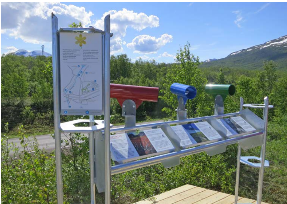
Bild 15. Upptäckarplatser i Abisko nationalpark berättar om olika fenomen i landskapet och hjälper besökare att uppmärksamma dem.