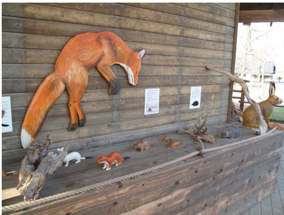
Bild 13. Det välbesökta friluftsområdet Skrylle i Lunds kommun har ett naturum, där själva byggnaden är liten men väldisponerad. De snidade djuren och frågorna längs ytterväggarna gör naturum attraktivt även när huset är stängt och väcker uppmärksamhet inte minst hos barnen.

En del naturum har utställningsliknande naturvägledning utomhus. På så sätt skapas en naturlig övergång mellan inomhusutställningen och området utanför. Utomhusutställningen erbjuder naturvägledning som är tillgänglig för besökare även när naturumet är stängt.