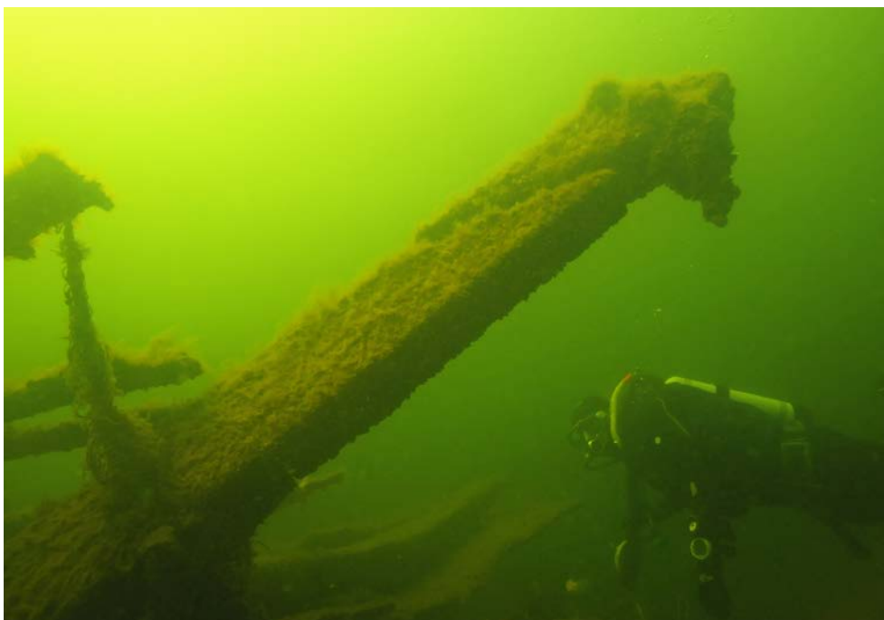
Bild 12. I Axmar Blue Park utanför Gävle kan besökare dyka, paddla, snorkla eller simma till besöksplatser som berättar om både undervattensnatur och skeppsvrak. Liknande leder finns inom projektet Nordic Blue Parks i Danmark och Finland.

Snorkel- eller dykleder finns på flera platser i Sverige i anslutning till såväl badplatser som nationalparker 83 . Dykaren leds längs en självguidande stig med skyltar om havets djur, växter, skeppsvrak och annat. Genom att hålla fast i ett handtag och borsta rent skylten med en vidhängande diskborste går det bra att läsa med cyklop under vattnet. Liksom andra stigar kan dessa leder också anpassas för personer med funktionsvariationer, till exempel med taktila inslag för besökare med nedsatt syn.