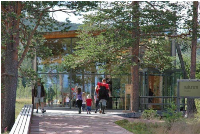
Bild 7. Naturum Fulufjället vid nationalparken har några tydliga huvudattraktioner som är lätta att uppleva. Här finns Njupeskärs mäktiga vattenfall, världens äldsta träd, lavskrikan som kan lockas fram med matning samt det spektakulära fjället i sig. Med utgångspunkt från dessa attraktioner kan man lyfta fjällets naturtyper, ekologi och mångfald, växter, djur och geologi.

Natur och företeelser i naturen är det vanligaste ämnet för naturvägledning i skyddade områden. Det kan handla om allt från stora sammanhang som naturskogar och fjällkedjan till vattenfall och varglavar, intressanta miljöer eller fascinerande anpassningar.