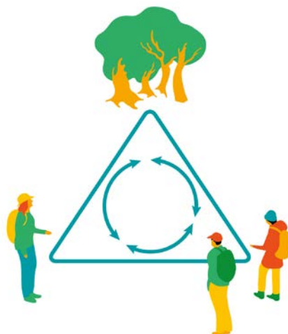
Bild 4. Naturvägledning som planeras enligt modellen i denna handbok kan betraktas som ett ömsesidigt växelspel mellan besökare, resurs/det naturvägledningen handlar om och naturvägledare eller andra medier som skyltar, utställningar osv. I mitten av denna så kallade interpretations-triangel finns temat – huvudidén eller den röda tråden för naturvägledningen på en plats eller i ett område 51 . Läs mer om besökare och tema i avsnitt 3.3.3–3.3.4. Illustration: Elsa Wikander/Azote.