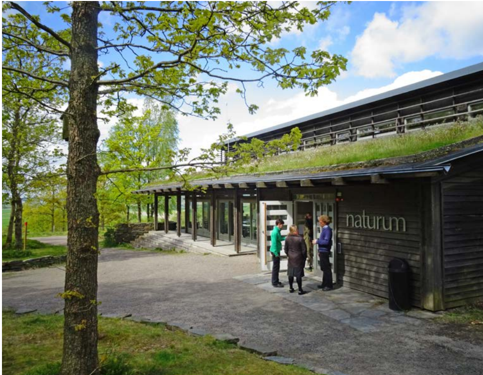
Bild 1. Riktlinjerna för verksamheten vid naturum kan användas för att uttrycka syften med naturvägledning generellt. Naturum Fjärås Bräcka, Hallands län.