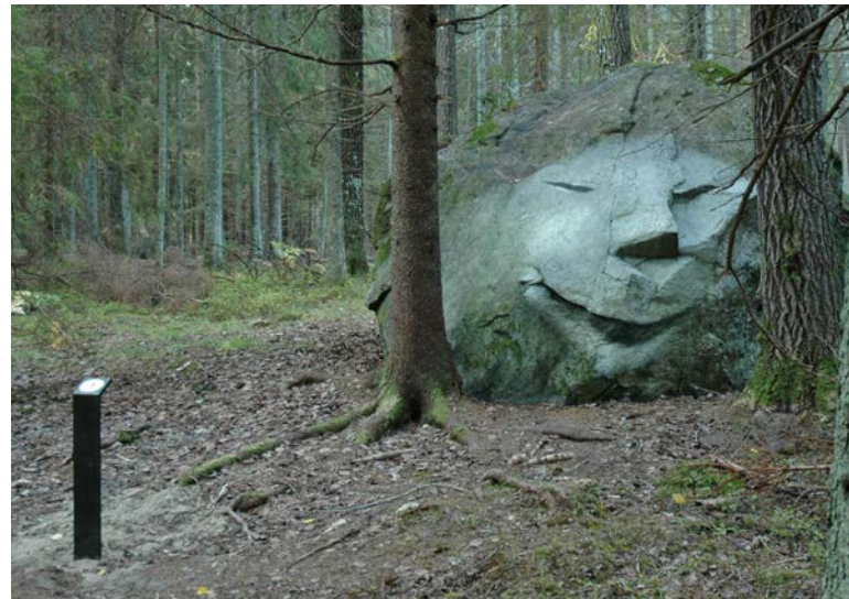
Bild 11. Tjäderstigen är en kombinerad naturväglednings- och äventyrsstig för barn och unga i Tyresta by, i naturreservatet strax utanför nationalparken. På elva platser finns en nummerad stolpe där det finns något att göra eller fundera på. Man kan ta med sig ett frågehäfte vid starten eller bara leka och uppleva. Utvärderingar visar att både barn och vuxna är mycket nöjda med stigen. Naturum har också samlat in utvecklingsförslag i samarbete med en närliggande skola.