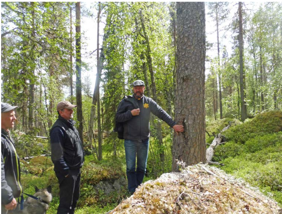
Bild 6. I Björnlandets nationalpark, Västerbottens län, finns "Spår i träd" med som ett särskilt karttecken, och besökarna uppmuntras att rapportera mänskliga spår som de själva hittar – ett bra exempel på att skapa delaktighet.