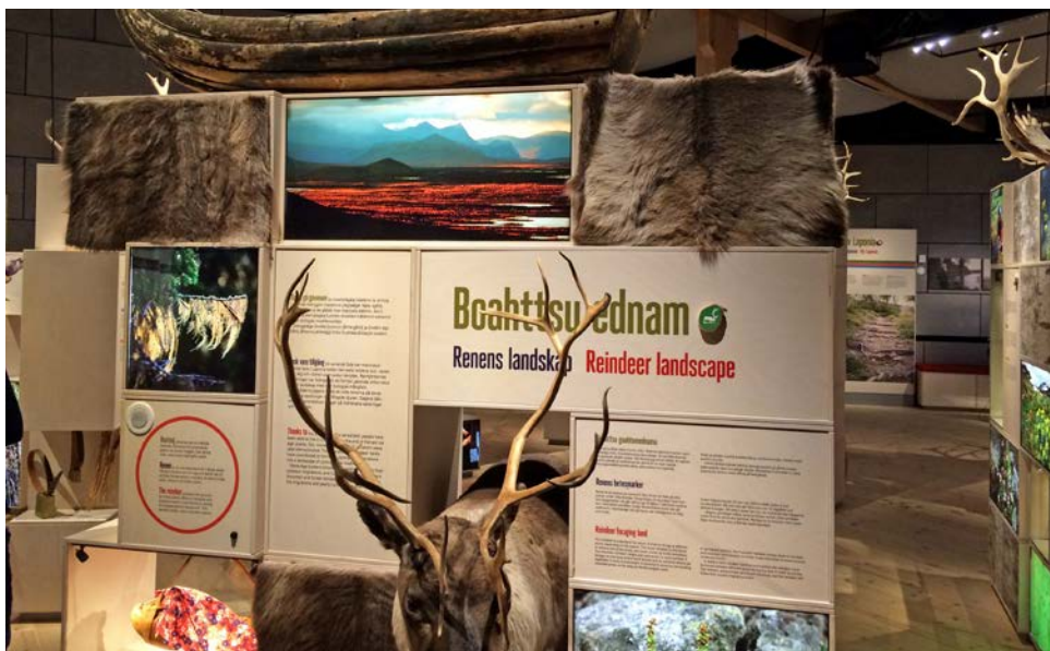
Bild 3. Förvaltningen av världsarvet Laponia inkluderar alla intressenters behov och perspektiv, med tonvikt på det samiska perspektivet. Naturvägledningen i Laponia – här på naturum – bygger mycket på berättelser från olika användare av området. Exempelvis kan man ta del av ett antal filmer med berättelser från renskötare, turister, forskare och andra aktörer.