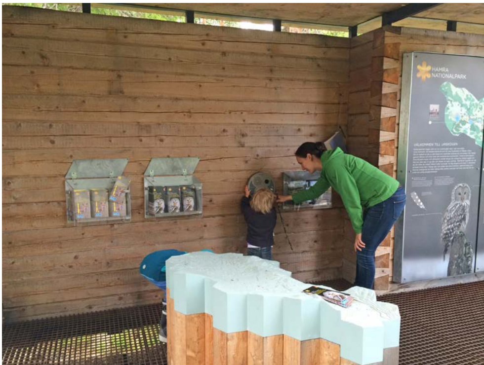
Bild 14. Naturvägledning vid huvudentrén till Hamra nationalpark, med varumärkesprofilen för Sveriges nationalparker. Vevlådan (u-turn) är populär hos både barn och vuxna. Längst fram ses en taktillkarta över parken och till höger mer traditionell information. Vevlådor finns även i andra nationalparker samt till exempel längs Tjäderstigen i Tyresta, i Kristianstads vattenrike och längs en spångad led vid Tåkern.

Man kan även hänvisa till en eller flera platser dit man vill att besökarna ska bege sig för upplevelser eller mer information.