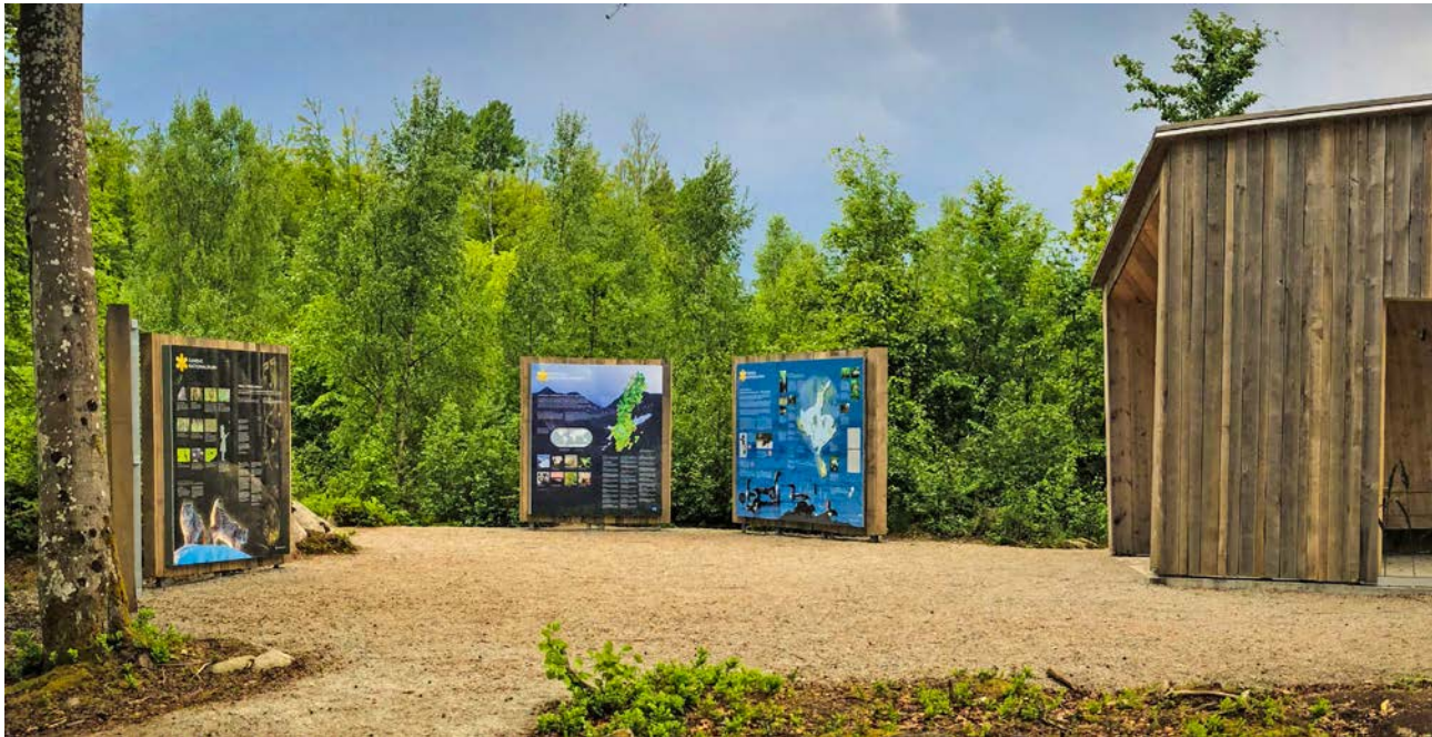
Bild 5. I arbetet inför bildandet av Åsnens nationalpark var kännedom om besökare en viktig bakgrund till var entréer och skyltar placerades. Diskussioner kring detta fördes bland annat i CNV:s arbete med ett förslag till naturvägledningsplan 58 och i samband med utbildning för nationalparksförvaltare kring nationalparkernas varumärkesarbete.

Man kan med fördel skapa egna kategorier utifrån kunskap om plats, besökare och egna önskemål.