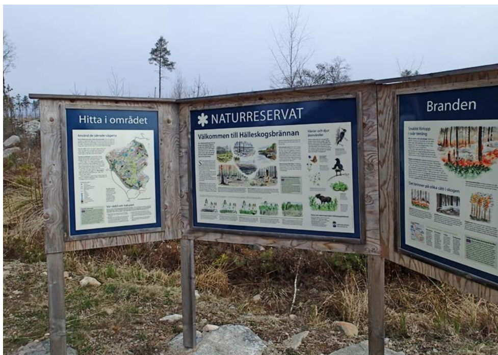
Bild 2. Ett välgenomtänkt skyltställ kan tillgodose delar av både ankomst- och anknytningsfasen. Hälleskogsbrännans naturreservat, Västmanlands län.

Frågor att ställa sig som planerare kring denna fas är till exempel: Vad önskar man att besökaren ska tänka och känna efter besöket? Hur kan naturvägledningen utformas för att uppnå det?