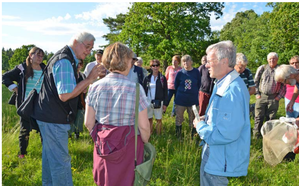
Bild 16. I flera län eller regioner samsas organisationer i samordnade guideprogram. Östergötlands natur- och kulturguidningar (bilden) är ett bra exempel på välbesökta aktiviteter där en natur- och en kulturexpert guidar tillsammans. Besökare med olika intressen får då ofta oväntade aha-upplevelser. Ett annat exempel är Västkuststiftelsen, som erbjuder en mångfald av guidade vandringar i Västra Götalands natur, inte minst i skyddade områden. Årliga enkäter till deltagarna visar på stor uppskattning av verksamheten.

Tillgänglighet är naturligtvis grundläggande även i detta sammanhang. Många tips för guidning som underlättar tillgänglighet finns i Tillgänglighetshandboken : vägval med få fysiska hinder, planera stopp med sittmöjligheter, platser med god utsikt och förståelse för området utan långa gångsträckor med mera.