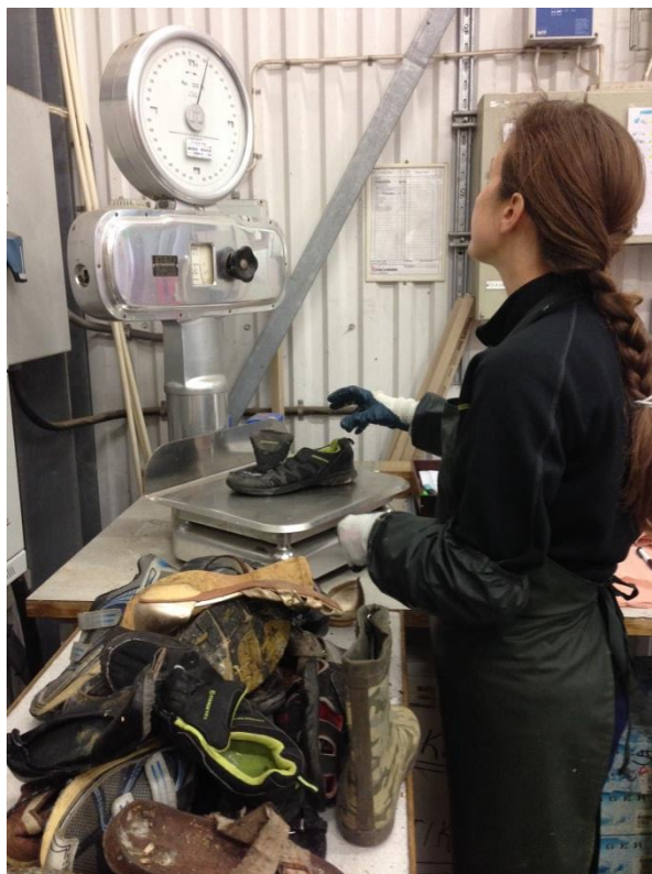
Figur 1. Vägning av skor funna i restavfall vid en av projektets plockanalyser. (Vukicevic, 2015)

till att textilierna markerades som hela eller trasiga var för att få information om textilierna kunde återanvändas eller materialåtervinnas. Materialslagen som noterades vid plockanalyserna var bomull, polyester, polyamid, viskos, ull samt blandade och övriga. Varje textil vägdes och redovisades i gram.