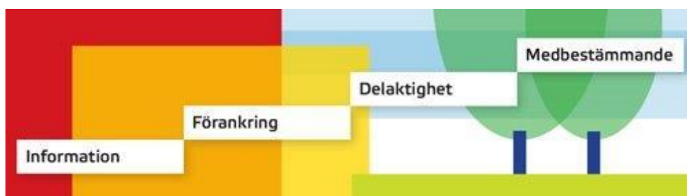
Figur 1. Deltagandetrappan beskriver olika grader av deltagande i beslutsprocesser (från Boverket.se)

Dialog och samverkan är deltagandeprocesser , där tjänstemän och ämnesexperter lär av lokala aktörer (boende, nyttjare, markägare etc.) och vice versa. Graden av deltagande i en sådan process brukar illustreras med den så kallade deltagandetrappan (figur 1), där de olika trappstegen/nivåerna representerar olika grad av deltagande enligt nedan.