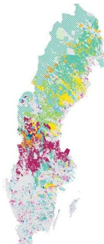
Figur 3. Karta över större markägares skogsinnehav

I län med stor andel bolagsägd skog blir de större skogsbolagen en viktig dialogpartner i arbetet med grön infrastruktur (se figur 3). Frågor att arbeta med i dialogen med dessa är hur kunskapsunderlag kan tillgängliggöras och användas samt hur befintliga prioriteringar när det gäller frivilliga