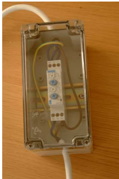
Figur 3. Tidur som styr den intermittenta provtagningen.