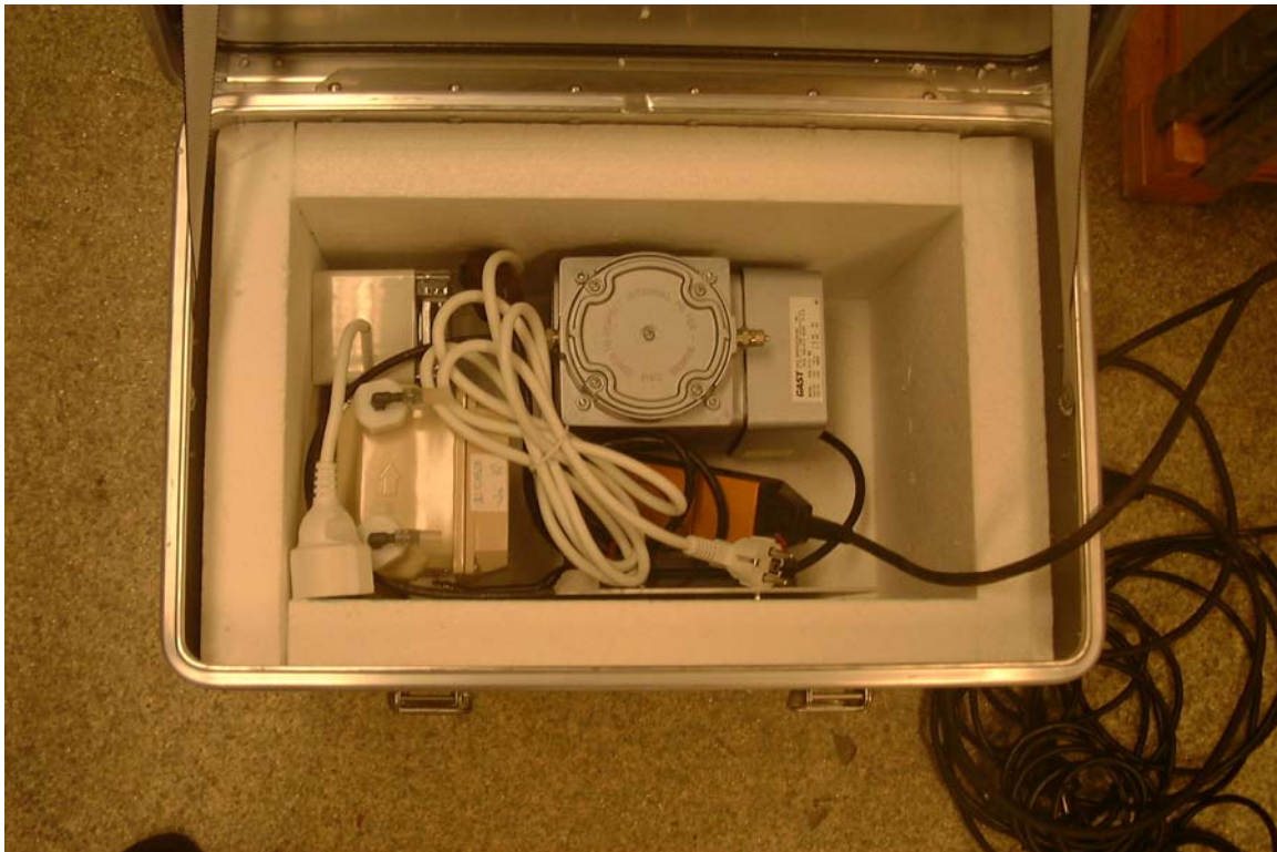
Figur 1. Uppvärmad isolerad låda med tidur, pump och gasmätare.

Provluffsintaget skall vara placerat i ett fritt läge, 3-4 meter över marknivån. Provtagningen kräver tillgång till ström (220 V) för att pumpa luften genom mätinstrumentet.