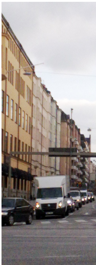
Hornsgatan i Stockholm