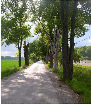
Kan hysa många arter.