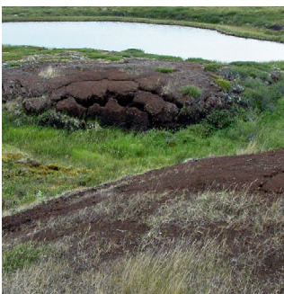
Pals i Tavvavuoma.

Vissa palsmyrar håller på att tina, det visar tidigare studier. Nu planeras för ytterligare studier och palsmyrarna ska undersökas med hjälp av laserskanning och högupplösta satellitbilder. Eftersom palsmyrarna omfattas av EU:s art- och habitatdirektiv har Sverige skyldighet att övervaka deras tillstånd och målet är att palsmyrarna ska få ett övervakningsprogram.