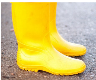
Skor och stövlar kan innehålla ftalater.

Vår urin kan innehålla många olika nedbrytningsprodukter (metaboliter) från ftalater. Det visar en analys av urin från 20 kvinnor från Stockholmsområdet. Syftet med studien var bland annat att jämföra halter med resultat från andra länder och få en indikation på hur mycket kvinnor i Sverige exponeras för ftalater och andra förorenande ämnen.