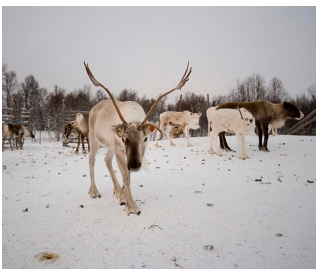
Viktig art.

Renar, fjällrävar, ripor och jaktfalkar är några av arterna i fjällvärlden som räknas som nyckel- eller ansvarsarter. En nyckelart är en art som är viktig som föda eller som på annat sätt påverkar ett stort antal andra arter. En ansvarsart kan sägas vara en ovanlig art som i stort sett bara finns i ett visst län. Den har sin svenska, europeiska eller till och med världsutbredning just där och länet har därför ett särskilt ansvar för att arten ska bevaras.