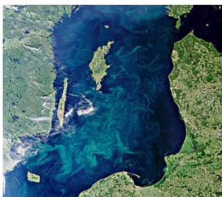
Algblomning från rymden

Arbetet med operativ fjärranalys behöver samordnas bättre för att bli effektivt. Försvarsmakten, Lantmäteriet, MSB, Naturvårdsverket, SCB, SLU, SMHI, Rymdstyrelsen och Skogsstyrelsen föreslår därför gemensamt att en särskild samverkansgrupp ska koordinera arbetet mellan berörda myndigheter. Förslaget har tagits fram på uppdrag av regeringen.