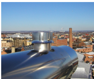
Luftmätare i Norrköping.

Mätning av marknära ozon i Sverige följer inte EU-direktivet om luftkvalitet och renare luft i Europa. Därför ska det nationella övervakningsprogrammet för ozon utökas med att antal mätstationer. Framst behövs fler stationer i förortsområden där mätningar i stort sett saknas idag.