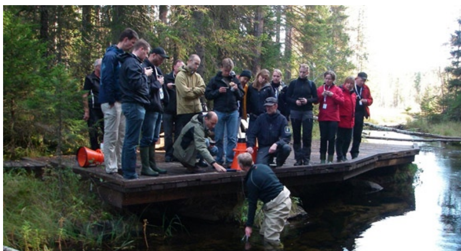
Exkursion till Navarån.