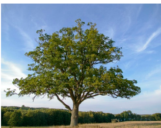
Vid Hammersta gård, Nynäshamn

Mycket gamla, stora eller grova träd har ofta stora naturvärden. Träden kan erbjuda många olika livsmiljöer, som håligheter, skrovlig bark eller döda vedpartier och är viktiga för en mängd olika arter. Många av de lavar, svampar, insekter, fåglar och fladdermöss som lever i träden finns dessutom med på listan över hotade arter.