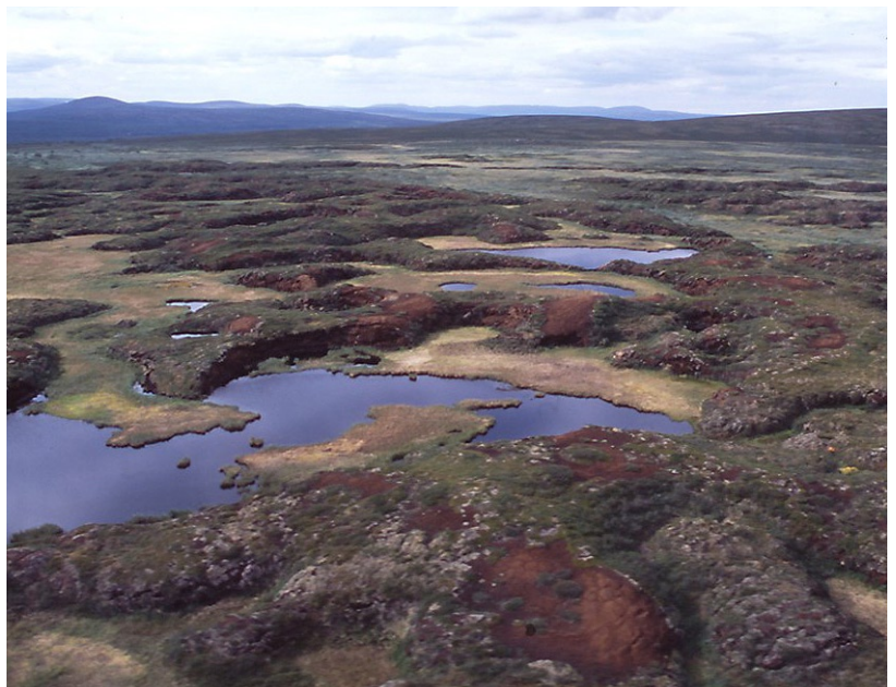
Palsmyr, Ribatoaive.