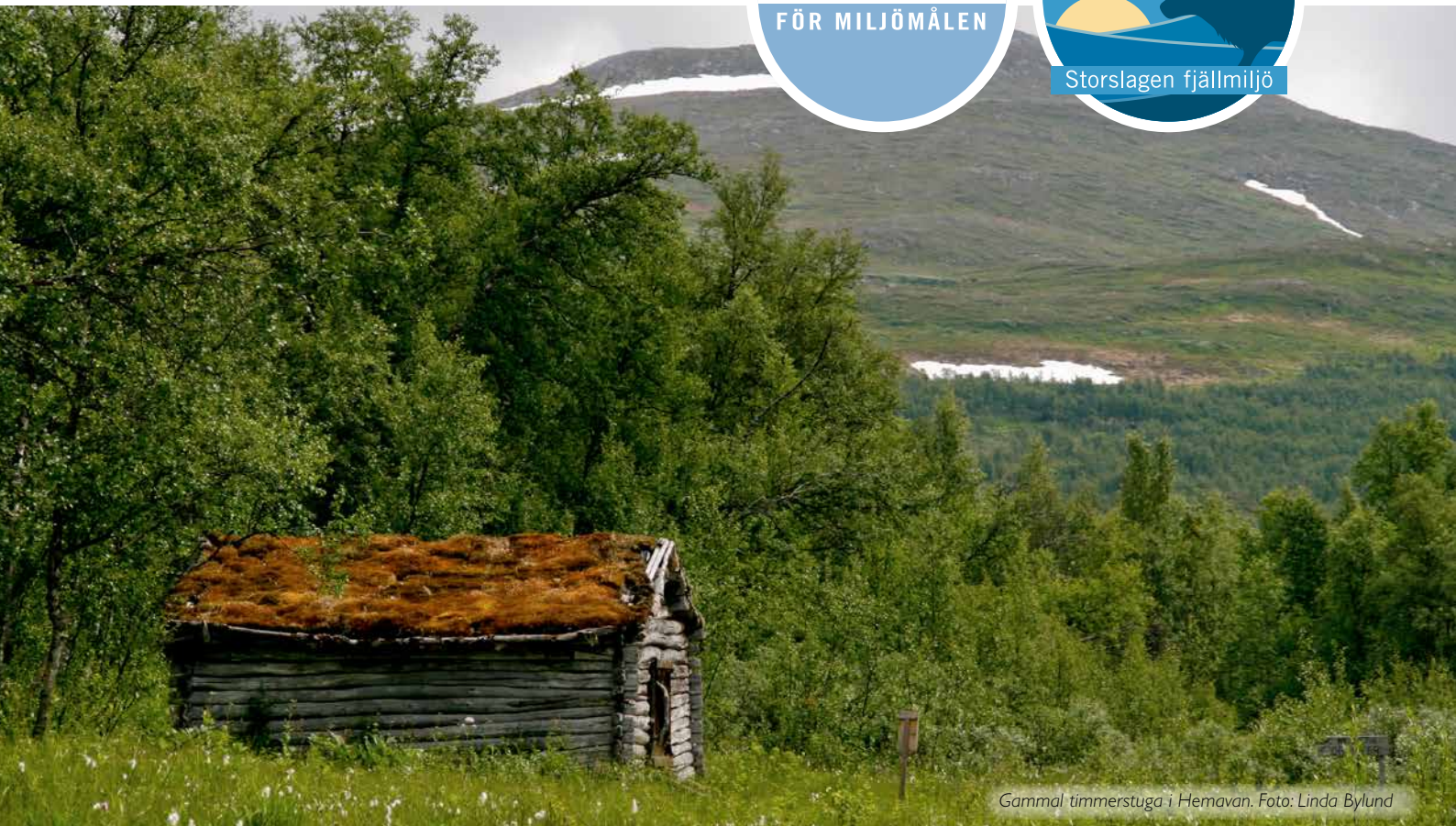
Gammal timmerstuga i Hemavan.