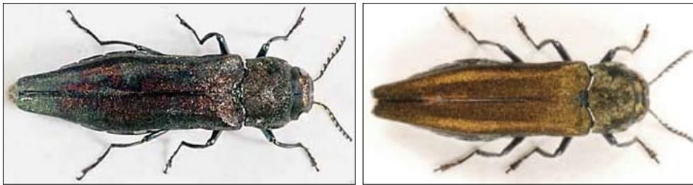
Figur 1A och 1B. Fullbildade rönnpraktbaggar.

Rönnpraktbagge är en av våra största smalpraktbaggar (släktet Agrilus ). Kroppslängden hos den fullbildade skalbaggen är cirka 12 mm. Ovansidan är oftast bronsfärgad, med en antydning till purpur. Ibland är hela eller delar av ovansidan purpurfärgad. Undersidan, ben och antenner är blågröna. Det relativt stora huvudet är försett med smala längsfårer och en kort vit behåring. Mellan ögonen löper en smal glänsande fåra. Halskölden har raka sidor men smalnar av bakåt och har de ovan nämnda längsgående kölarna vid bakhörnen. Även halsskölden har tätt med tvärgående smala fåror på oversidan. Täckvingarna har en ganska fin punktur som är jämnt spridd. Längst bak är spetsarna på täckvingarna lätt utåtsvängda med små borstförsedda kitintaggar på kanterna (figur 1).