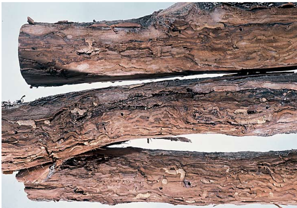
Figur 7. Angrepp av rönnpraktbagge.

Används fönsterfällor töms de var tredje dag från midsommar till mitten av juli. Lockvirke kan läggas i form av ett ”res” (grenar lutade mot varandra) vari en fönsterfälla kan apteras med plexiglas- eller celluloidskivan strax över överkanten på virket mitt i det V-formade arrangemanget. Fångas rönnpraktbagge avbryts inventering med fönsterfällor omedelbart. Lägg virke ut ett år kan man nästa år försiktigt undersöka om det finns angrepp i virket.