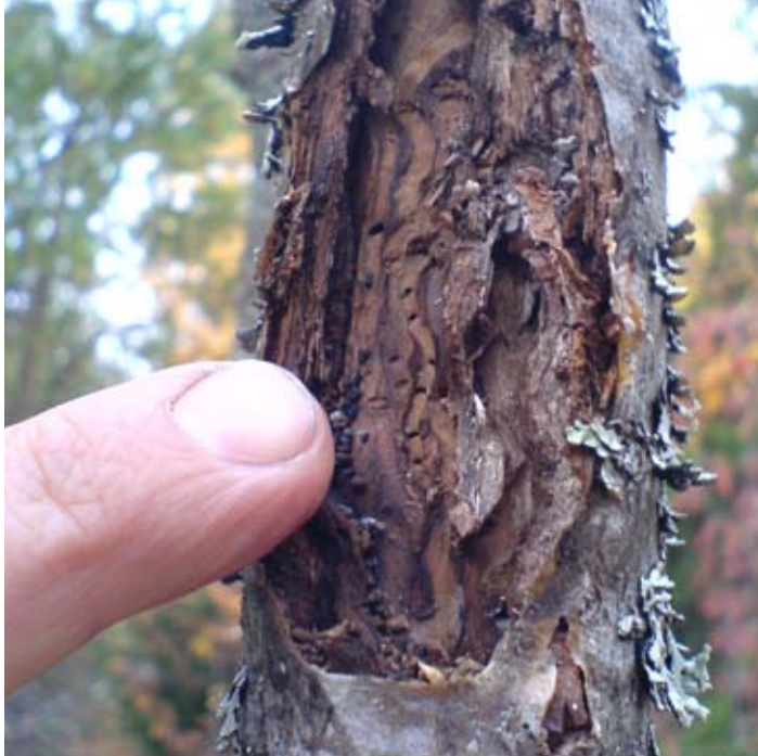
Figur 3 till vänster. Stamdelen av rönn med larvgångar av rönnpraktbagge.