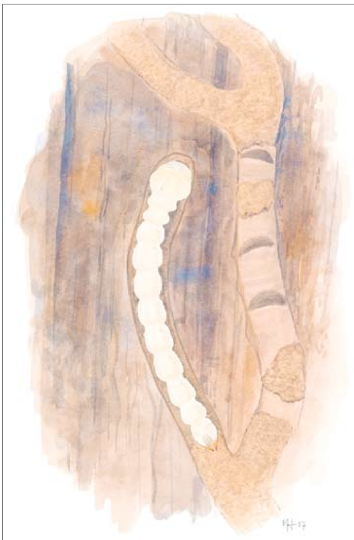
Figur 2. Larv av rönnpraktbagge. Illustration Martin Holmer