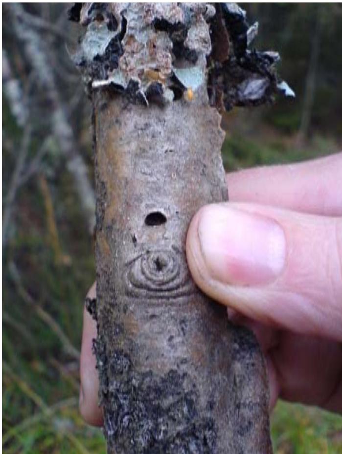
Figur 4 till höger. Grendel av rönn med kläckhål från fullbildad rönnpraktbagge. Observera den ovalt avskurna u-formen.