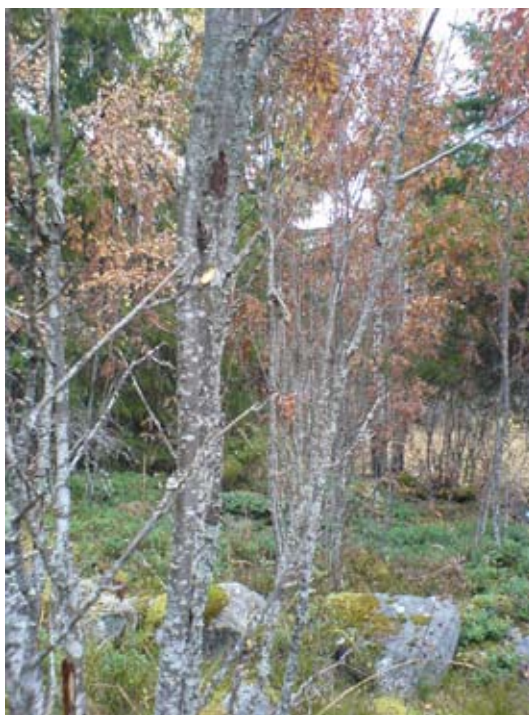
Figur 5. Klen rönnstam med ca 5 år gammalt angrepp, i form av ett handflatsstort ovalt dött område på en i övrigt levande stam. Bilden tagen vid Plintsberg, Dalarna i september 2005.

Angripna ställen är oftast handflatstora ovala döda ställen på en i övrigt levande stam (figur 5). Det finns ofta en antydning till övervallning med levande ved i kanten av angreppet. Den vuxna skalbaggen gnager runda hål i levande rönnblad.