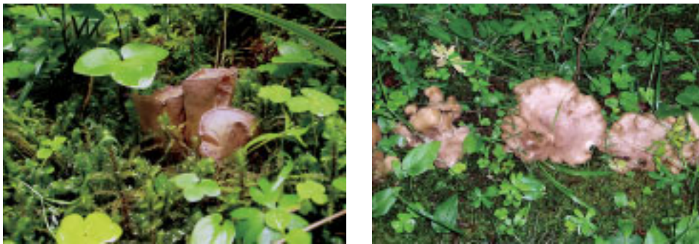
Figur 1. T v unga violgubbar, t h sträng med violgubbar.

Violgubben ( Gomphus clavatus ) är en säregen hattsvamp som släktskapsmässigt står nära kantareller, klubbsvampar och fingersvampar, med vilka den också har flera gemensamma morfologiska drag. Tidigare har det svenska namnet varit klubblik trumpetsvamp och i folkmun har den även kallats ”grisöra”.