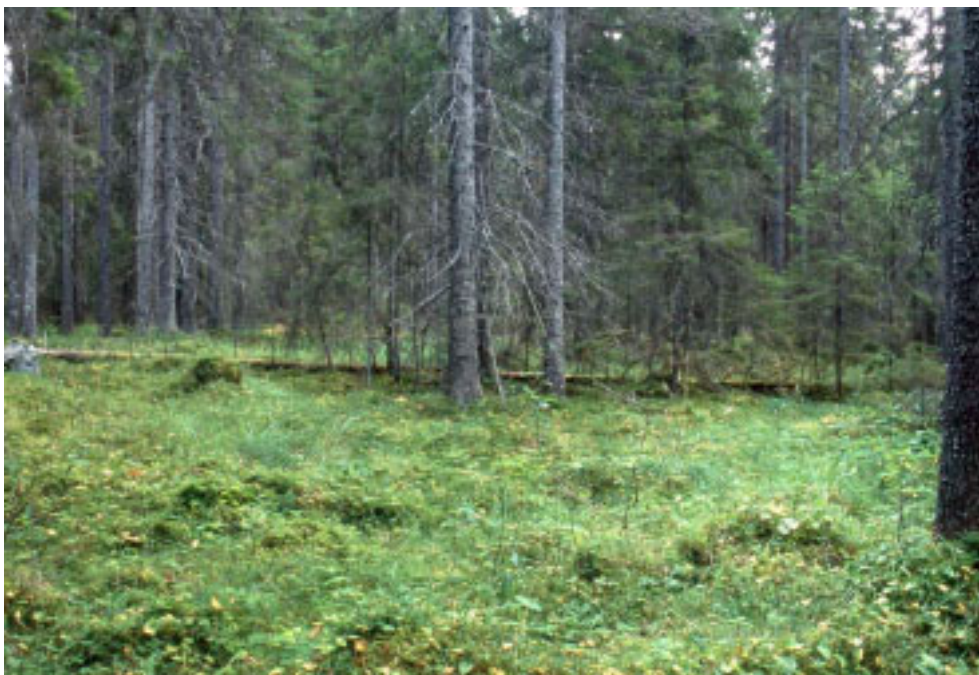
Figur 4. Violgubbens växtplatser i barrskog består ofta av flerskiktade, gamla skogsbestånd, som tidigare varit betespräglade, så kallade "bondeskogar". Måxbo i Norduppland.

I bokskog växer violgubben på lera eller sandig, mullrik jord, gärna i bäckraviner eller sluttningar intill sumpskogar. Rörligt markvatten och kalkhaltig jord verkar även i bokskog vara viktiga ståndorts krav för svampen. Växtplatsen karaktäriseras av ängstyp, medan omgivande bokskog kan vara av hedartad typ. Fält- och bottenkiktet på växtplatserna är ofta mycket sparsamt eller saknas helt. Då vegetation förekommer består den till exempel av harsyra, ekorrbär, lundslok, buskstjärnblomma, skogsbingel, lundarv, tandrot, gulplister och skärmstarr.