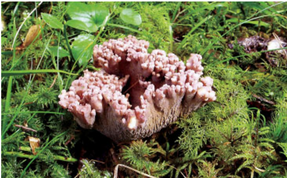
Figur 3. Märkligt fynd av violgubbe med starkt flikig hattkant i Bolstan, i Norduppland.

Ett egendomligt fynd av violgubbe gjordes hösten 2004 i Bolstan i norra Uppland. Svamparnas hattkanter var ovanligt starkt flikiga och påminde om en fingersvamp. Av intresse är att det redan finns en violettfärgad fingersvamp i örtrika granskogar, lilafotad fingersvamp Ramaria fennica , som dessutom visat sig vara nära släkt med violgubben (Daniels, Martin & Telleria 2002).