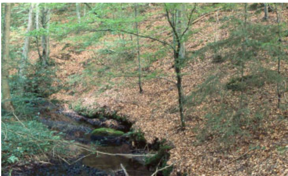
Figur 5. I bokskog växer violgubben gärna i bäckraviner eller intill sumpskogar. Julebodaån i Skåne.