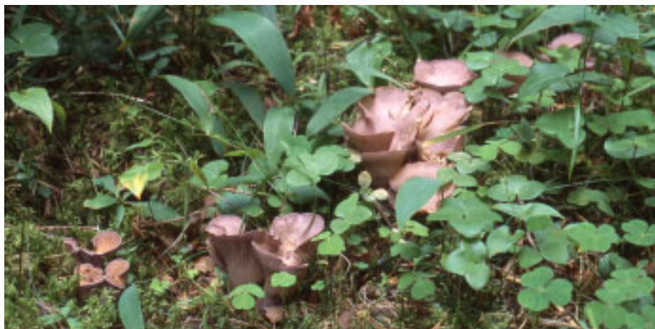
Figur 2. I barrskog växer violgubben gärna på mullrika brunjordar med lågörts-vegetation.

Violgubben är en markväxande, kompakt och köttig svamp med grunt trattformad hatt och oregelbunden, flikig kant. Utsidan är rynkad av gaffelgrenade åsar. Hatten övergår gradvis i en kort och tjock fot. Köttet är vitt och fast. Fruktkropparna blir 4-10(-15) cm höga och 5-10(-15) cm breda. Unga exemplar är tydligt violett-färgade, men den violetta färgen mattas av successivt och blir mer grålila. Snabbast försvinner färgen på hattens ovansida som blir brungul med grå eller oliv ton. Äldre svampar saknar ofta helt violett eller lila färger och är istället smutsigt brungula. Svampen växer i täta grupper eller stora gyttringar, vanligtvis i ofullständiga häxringar eller i långa rader.