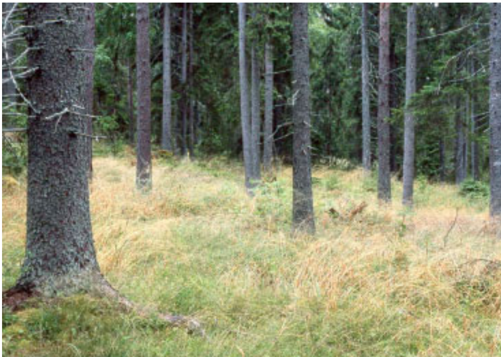
Figur 6. Kraftig utglesning av trädskiktet i örtrika barrskogar missgynnar violgubben och andra ovanliga mykorrhizasvampar starkt eftersom hög och tät vegetation av bland annat piprör och hässlebrodd växer upp efter avverkningen. Snesslinge i nordöstra Uppland.

Andra faktorer såsom luftburna föroreningar kan vara ett hot mot violgubben eftersom detta påverkar även skyddade områden. Mykorrhizasvampar är troligen känsliga för höga halter av kväve och fosfor. Särskilt kvävenedfall och en ökad markeutrofiering kan vara en av orsakerna till många mykorrhizasvampars tillbakagång (Arnolds 1989). Förutom en kontinuerlig gödslingsseffekt via luftföroreningar gödslas vissa barrskogsbestånd aktivt, så kallade vitaliseringsgödslings. Sådana gödslade skogsbestånd hyser ofta mycket få, om några, sällsynta mykorrhizasvampar. Vidare har grundvattensänkning orsakad av markavvattning de senaste 100 åren sannolikt påverkat flera mykorrhizasvampar negativt.