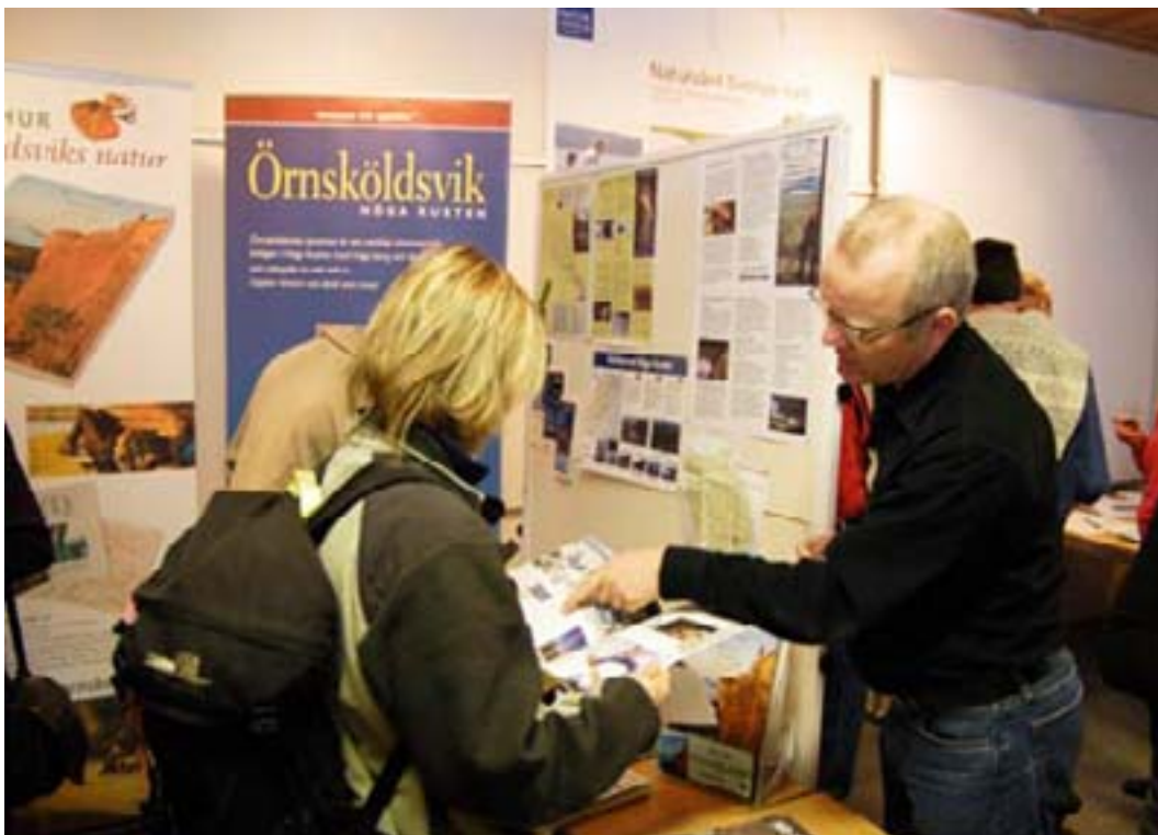
I Örnsköldsviks kommun är friluftslivet viktigt i samhällsplaneringen.

– Skola och närhet till rekreationsområden visade sig vara de två viktigaste faktorerna vid val av bostadsort, förklarade Hedström. Det gör i sin tur friluftslivet till en viktig del i alla kommuners arbete för en attraktiv bomiljö, bättre folkhälsa och för arbetet med strategier för en övergripande positiv utveckling.