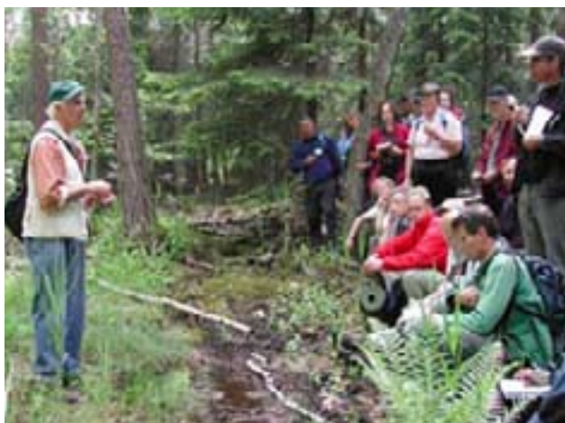
Utflykt i närnaturen.