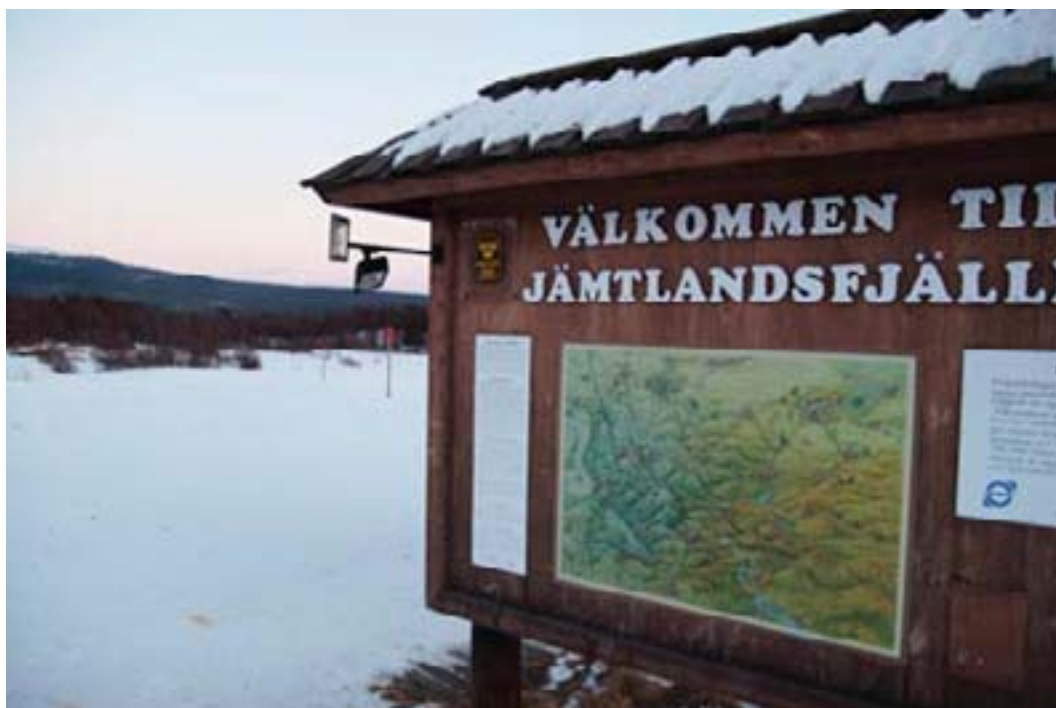
Inbjudan till friluftsliv vid Vålådalens fjällstation.

Lovande utveckling. Friluftsrådet har en sammanhållande funktion. FRISAM har ansvar för utveckling av forskarskolan. Naturvårdsverket bär frågan vidare genom utveckling av program och strategi för forskning om friluftsliv.