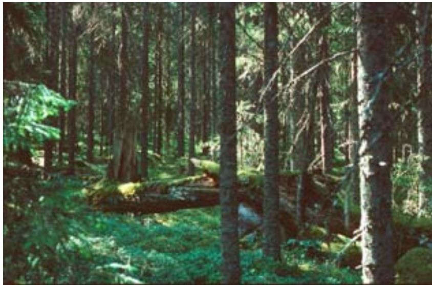
Figur 1. Gammal fuktig granskog med murken ved, Alfta i Hälsingland. Lämplig blåtryffelbiotop.

skaftrest i en änden och i den andra änden en liten papill. Svampen saknar speciell lukt.