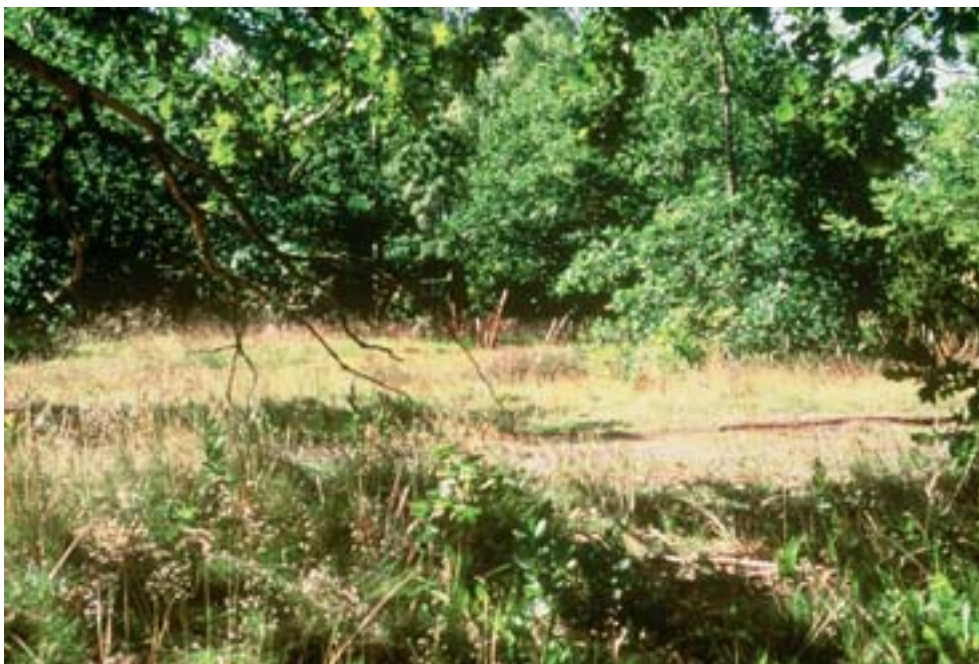
Fig 3. Livmiljö för lavdagsvärmare i Beijershamn, Öland.

Larverna är polyfaga, och kan sannolikt uppnå fördelar avseende överlevnad och tillväxt genom att blanda olika födoväxter under näringsöket. En studie av enskilda växters lämplighet visade dock på en stor variation i olika växtarters individuella lämplighet för larvutvecklingen (Betzholtz 2003b). Växter som ingår i larvdieten är ett flertal örter såsom gråfibbla, backtimjan, svartkämpar och bergsyra, men även gräsmossa och ekförna kan ingå. Där emot äter de inte lavar, vilket gör det svenska namnet på fjärilen mindre lämpligt. Under mildare perioder på vintern, då larverna tillfälligt kan vara aktiva, nyttjas framförallt ekförna som föda.