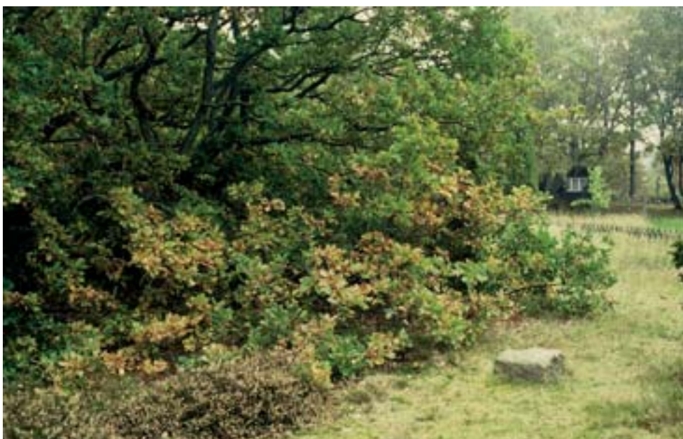
Fig 4. I varma kantzoner mellan torrängar och mer sammanhängande skog sker lavdagsvärmarens äggläggning och larvutveckling. Larverna lever i skydd av ekförfädd och har samtidigt tillgång till näringsväxter som gråfibbla.

Lavdagsvärmaren har studerats genom ett forskningsprojekt mellan 1993–2003. Flera vetenskapliga artiklar har publicerats, och resultaten från projektet har sammanfattats av Betzholtz (2004).