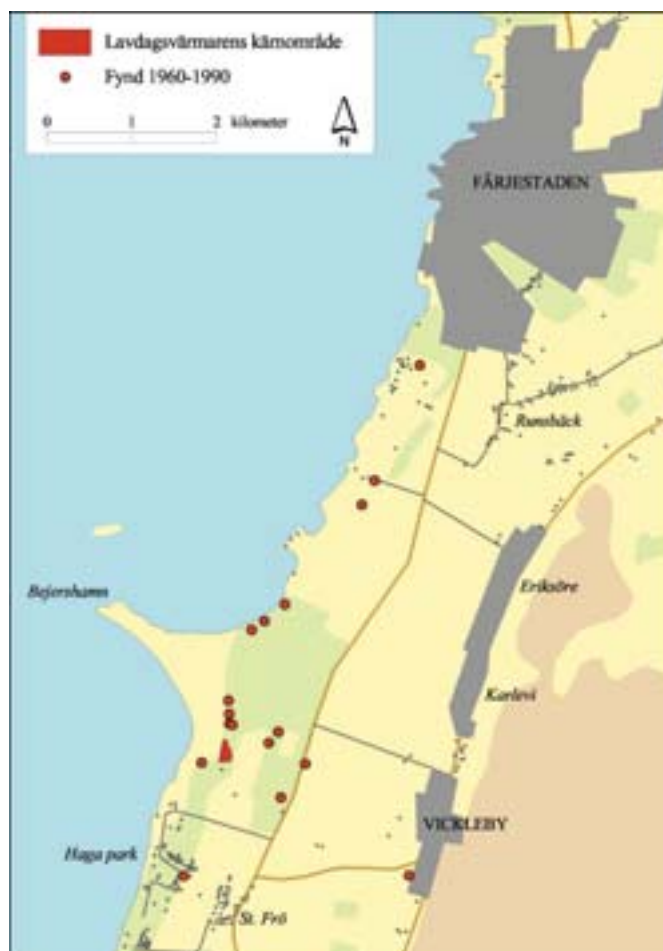
Figur 1. Karta över den nuvarande utbredningen, och fynd som gjorts i Beijershamnsområdet mellan 1960 och 1990.